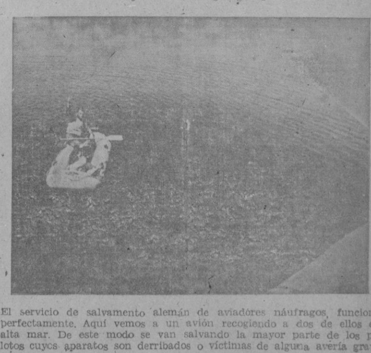
El servicio de salvamento alemán de aviadores náufragos, funciona perfectamente. Aquí vemos a un avión recogiendo a dos de ellos en alta mar. De este modo se van salvando la mayor parte de los pilotos cuyos aparatos son derribados o víctimas de alguna avería grave