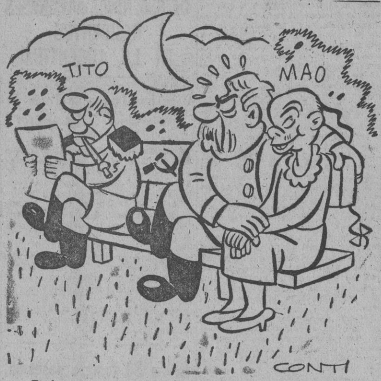
Tenlo presente, amor mio, La más pequeña mirada con ese bandido y te estrangulo.