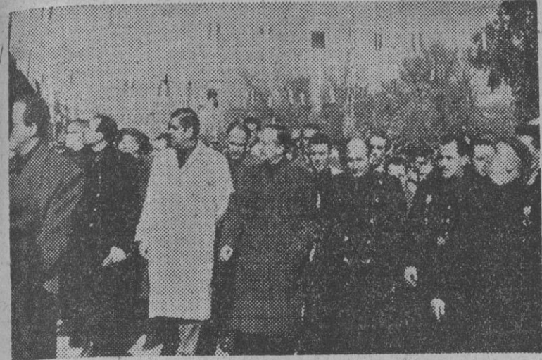
El ministro de Justicia, señor Fernández Cuesta, acompañado del gobernador civil y otras altas personalidades a su paso por las calles de Puertollano, recibe constantes muestras de adhesión por parte del vecindario. — (Foto Cifra)