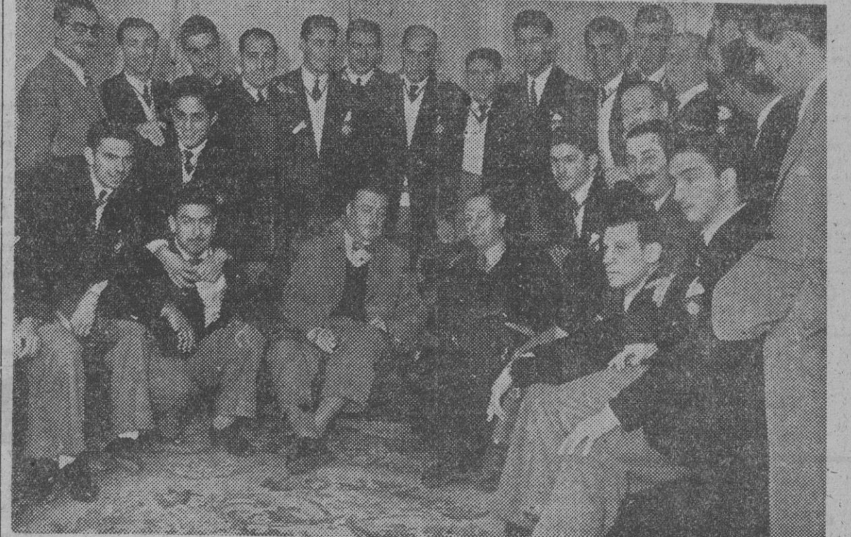
El embajador argentino, señor Radio, rodeado de los jugadores y directivos del San Lorenzo de Almagro, durante la recepción celebrada en dicha Embajada con motivo de su llegada a España de dichos deportistas.