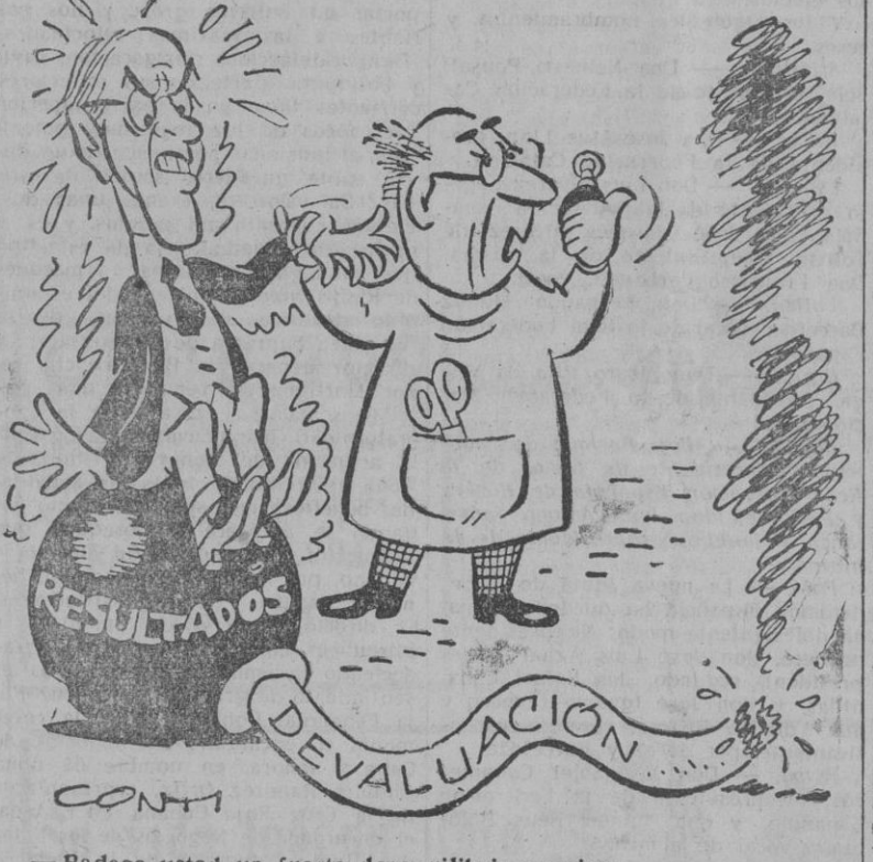
—Padece usted un fuerte desequilibrio nervioso.