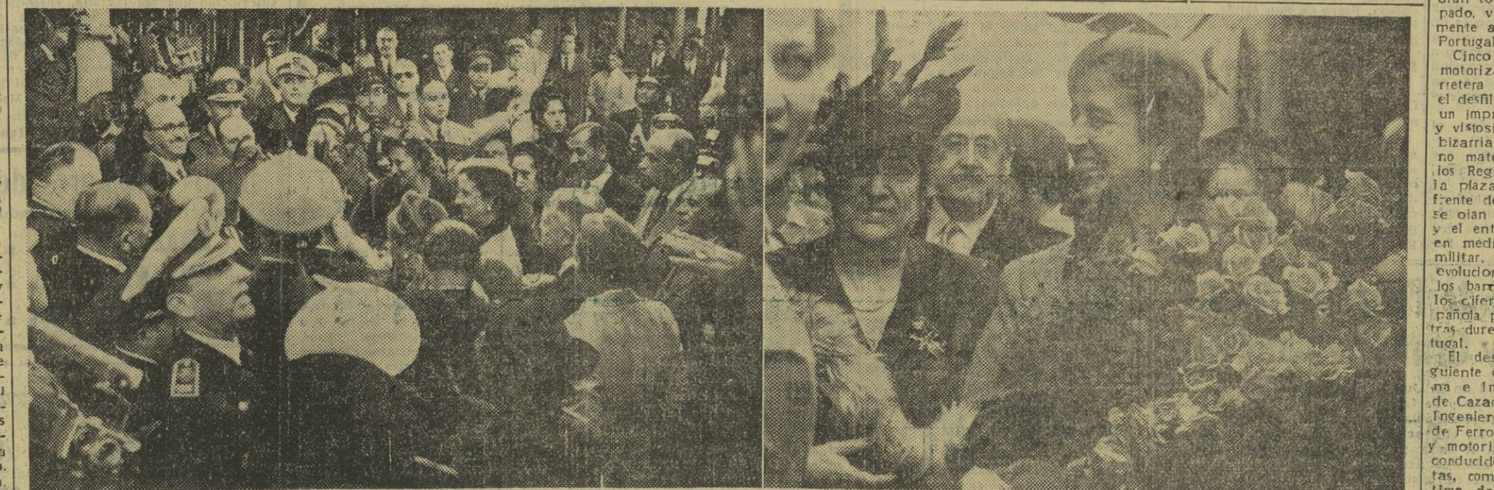
Dos momentos de la llegada de la esposa de S. E. el Jefe del Estado, doña Carmen Polo de Franco, a la estación de Lisboa, donde fué recibida por la esposa del presidente de la República, mariscal Carmona, y otras personalidades.