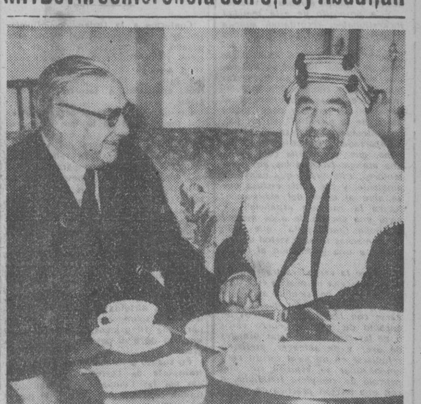
El rey Abdullah de Jordania, que actualmente se encuentra en Inglaterra, aparece en la fotografía conversando con el ministro de Asuntos Exteriores inglés, Mr. Bevin, en sus habitaciones del Hyde Park Hotel.