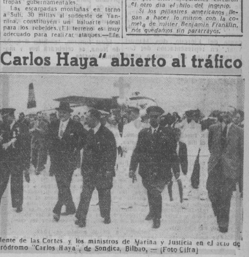
El ministro del Aire con el presidente de las Cortes y los ministros de Marina y Justicia en el acto de abrir al tráfico el aeródromo "Carlos Haya", de Sondica, Bilbao.

El "Aeropuerto Carlos Haya" abierto al tráfico