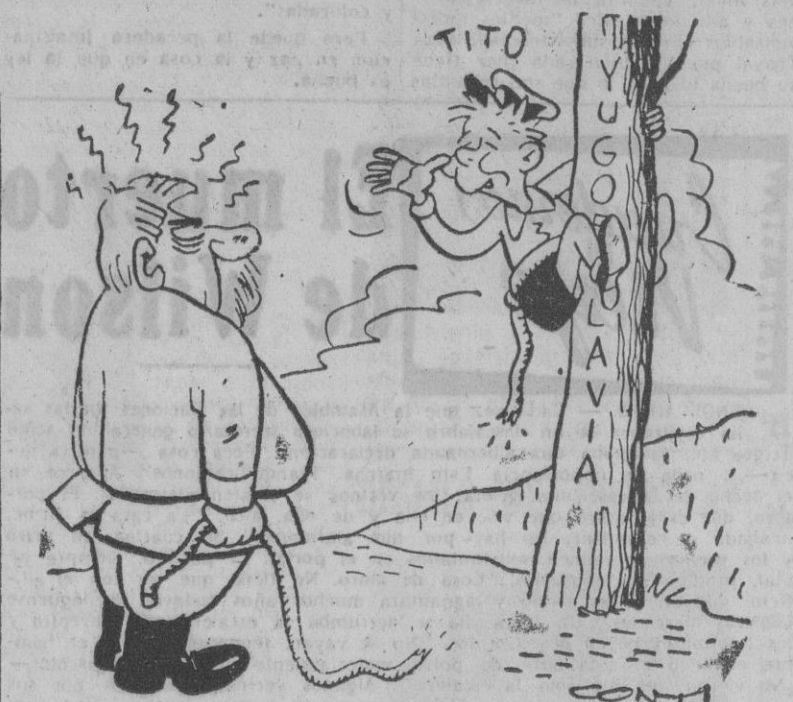
— No te quejes, papá Stalin, tú me enseñaste a ser grosero.

El Gobierno actual de Francia parece tener asegurada su existencia por ahora