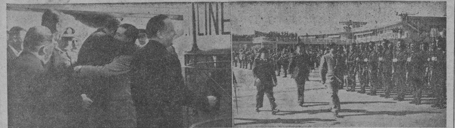
1. El ministro de Asuntos Exteriores, señor Martín Arata, abraza al general González Gallarza a su llegada al aeropuerto de Barajas procedente de la Argentina. — 2. El general González Gallarza revisa a las fuerzas que le rindieron honores al llegar al aeródromo.

Regresa de la Argentina el ministro del Aire