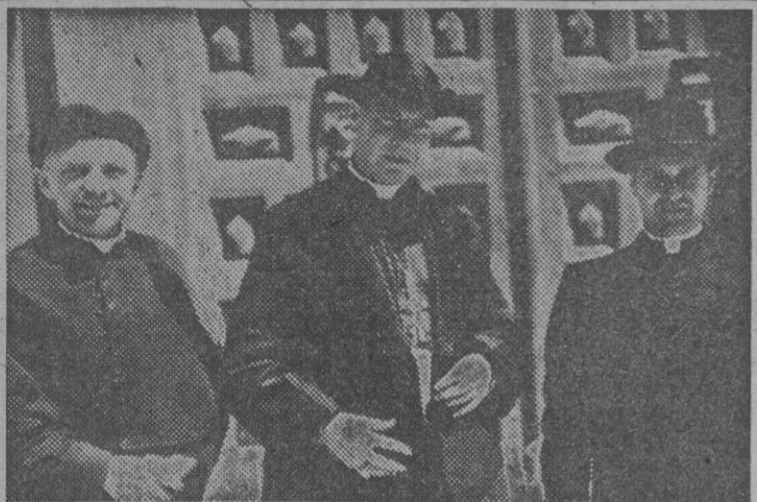
Monsenor Alejandro Vachon, arzobispo de Ottawa (Canadá), con los sacerdotes que le acompañan, durante su visita a la Catedral de Burgos