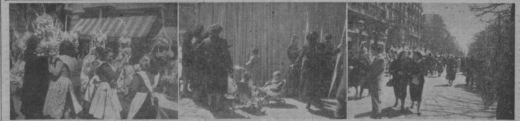
Como preparativos al domingo de Ramos, de tanta tradición barcelonesa, ha empezado en nuestra ciudad la venta de palmas y ramos. Como de consuetud, el mercado o feria se centraliza a lo largo de la Rambla de Cataluña y allí se exhiben verdaderas obras de arte y filigranas de una paciencia benedictina que demuestran tan buen gusto en el expositor como en el adquirente. He aquí tres vistas de dicha feria.