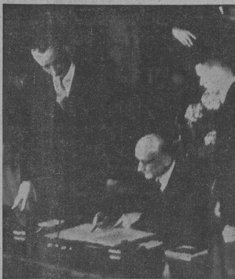
El ministro de Negocios Extranjeros francés, Mr. Robert Schuman, firma el protocolo del Pacto del Atlántico en nombre de su país