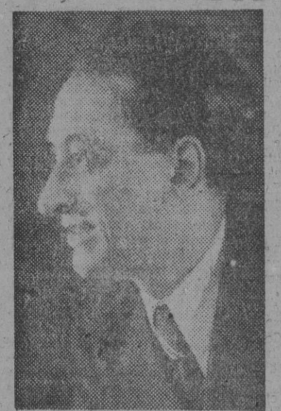
El gran barítono Marcos Redondo, que anoche cantó admirablemente en el teatro Borrás "El Caserío" del maestro Jesús Guridi