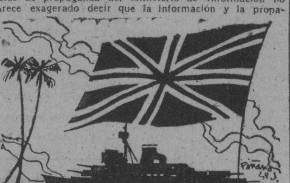
ganda coloniales se han convertido en el objetivo número uno de la Gran Bretaña.

A pesar de todas sus dificultades económicas y financieras, Inglaterra no descuida sus deberes con las colonias que aun le restan después de la terminación de la guerra y a pesar también de la reducción de los servicios de propaganda del Ministerio de Información no parece exagerado decir que la información y la propa-