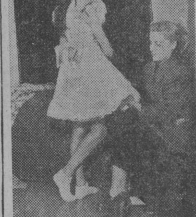
Julie Andrews, de 13 años de edad, que como ballarina se presentará en el London Palladium el día 21 del actual. Se reveló como poseedora de una magnífica voz cuando llamaba a su familia para que bajasen al refugio antiaéreo, durante la pasada guerra.

AFIRMA EL JEFE DE LOS SERVICIOS DE PREVISION DEL OBSERVATORIO METEOROLOGICO DE MADRID