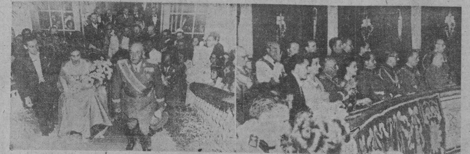
1. S. E. el Jefe del Estado, acompañado de su esposa, doña Carmen Polo de Franco, entró en el teatro Victoria Eugenia, de San Sebastián, donde tuvo lugar una función de gala en su honor. — 2. El Caudillo con su esposa, acompañado del alcalde de San Sebastián, señor Azpilluega y señora, y de los ministros del Gobierno, durante la mencionada función de gala. — (Fotos Cifra)