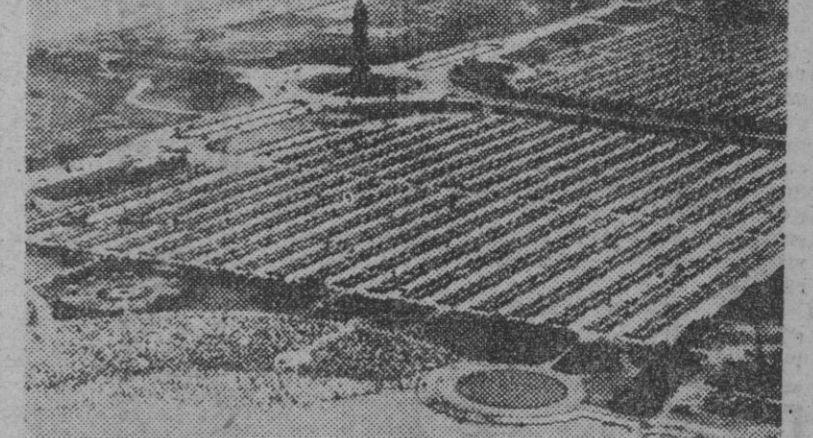
Exceptuando los edificios y la parte de agua que se aprecia en la fotografía, todo lo demás son millares de coches aparcados, en las inmediaciones de Jones Beach a cuyas playas han ido los propietarios de los automóviles a bañarse con objeto de combatir el intenso calor que se deja sentir con toda su fuerza en los Estados Unidos.