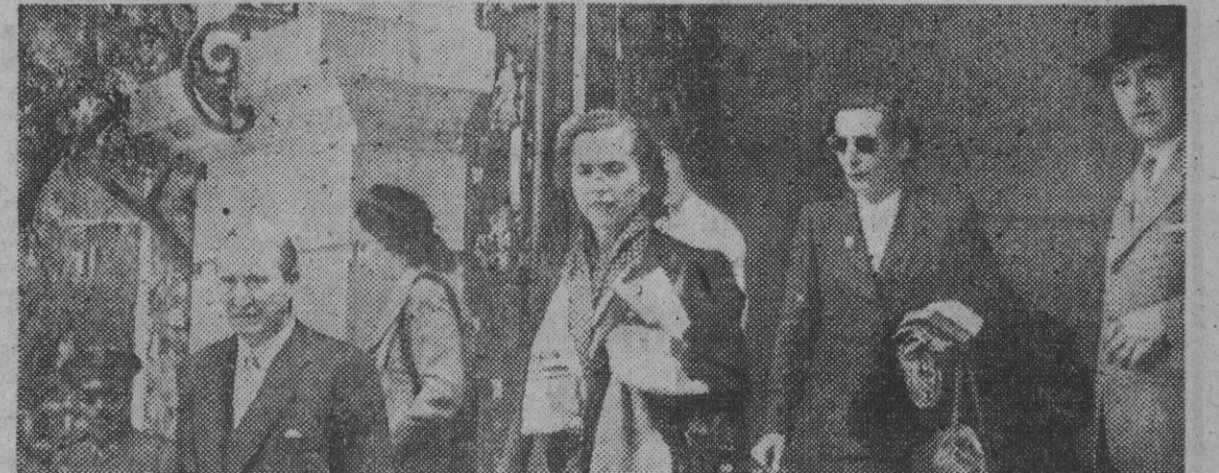
De paso para Barcelona, estuvo en la capital de España la princesa María José de Italia. Ha aquí a su Alteza saliendo del hotel donde se hospedó.