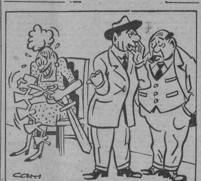
— Voy a presentársela, señor director. Es la escritora del guión que a usted le ha gustado tanto.

"El acuerdo de Bruselas no va dirigido contra nadie"