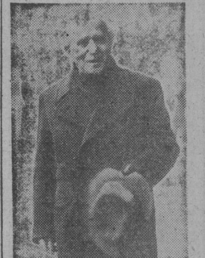
Ben-Gurion, presidente del Gobierno de Israel y encargado de Defensa, que dirigirá la lucha de los judíos contra los árabes.