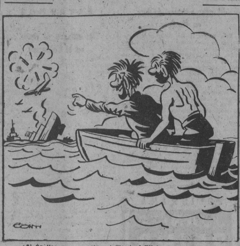
— ¡Al fin llegamos a costas civilizadas! Filate, una guerra.