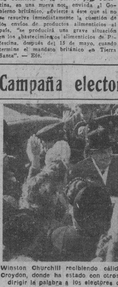
Winston Churchill recibiendo cálidas muestras de simpatía en North Croydon, donde ha estado con otros jefes del partido conservador, para dirigir la palabra a los electores de dicho distrito.