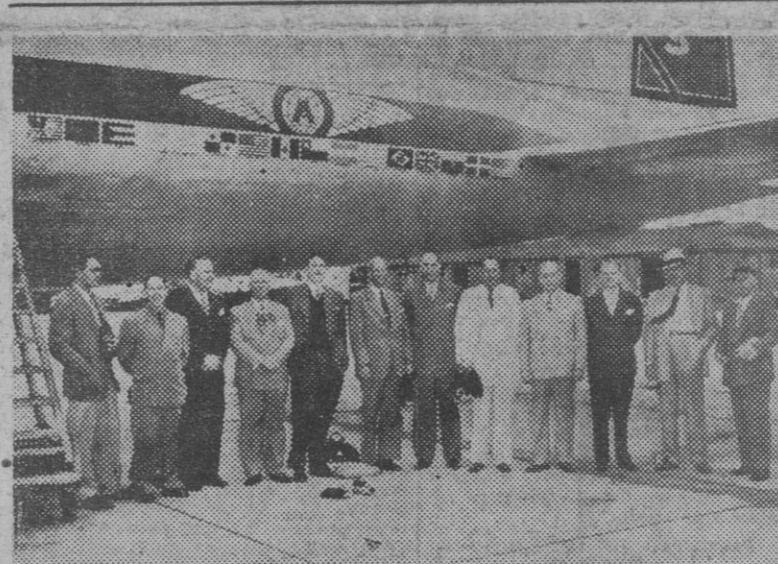
Magnates de los negocios y la industria norteamericanos han salido de Miami en un viaje por todo el Mundo, que tendrá cien días de duración. Aquí los vemos antes de tomar el avión. El viaje tiene carácter de negocios, principalmente.