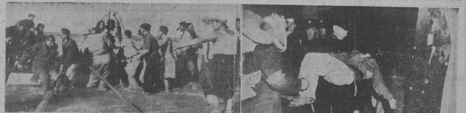
I. El fotógrafo pudo captar esta escena en Naharia, pueblito costero al norte de Haifa, donde desembarcaron, totalmente extenuados, 600 judíos del buque "United Nations". — II. Impresionante fotografía tomada en Jaffa, minutos después de un atentado judío. Un policía británico lleva en brazos el cadáver de un árabe. — (Fotos Cifra)