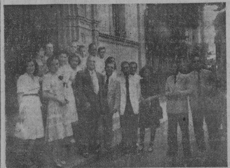
Durante estos días se encuentran en nuestra ciudad varios estudiantes egipcios, acompañados de sus profesores. He aquí al grupo saliendo de su residencia para recorrer nuestra ciudad.