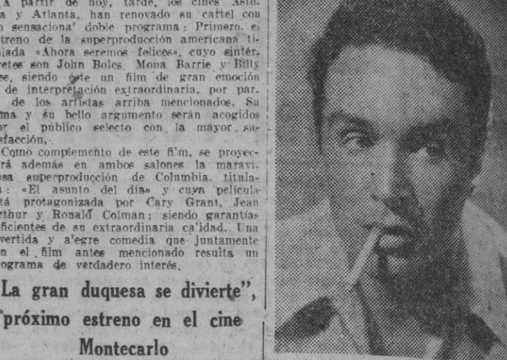
El galán Carlos Agosti, que tras excelentes intervenciones en las películas "Viento de siglos", "El pan de los enamorados", "Esperanza", "Aquel viejo molino", "Las inquietudes de Shanti-Andia"...