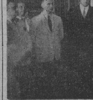
En el despacho del ministro de Asuntos Exteriores, el señor Martín Artajo imponen la Gran Cruz de Isabel la Católica al director del Instituto de Cultura Hispánica, don Joaquín Ruiz Jiménez.