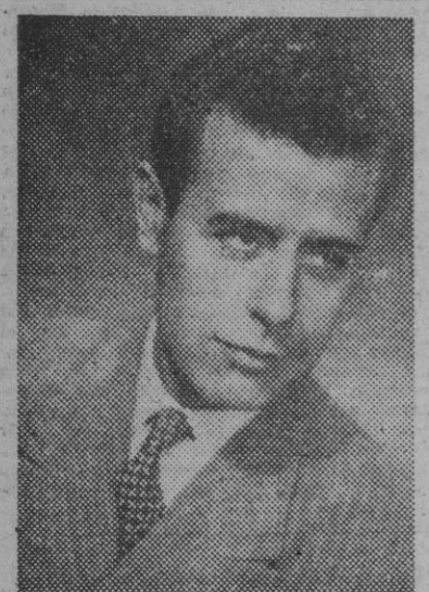
El notable y aplaudido tenor Es...