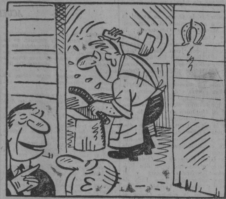
—El dice que la Fiesta de Exaltación del Trabajo debe celebrarse trabajando veinte horas.

«Creo en España, porque creo en este pueblo admirable que me sigue»