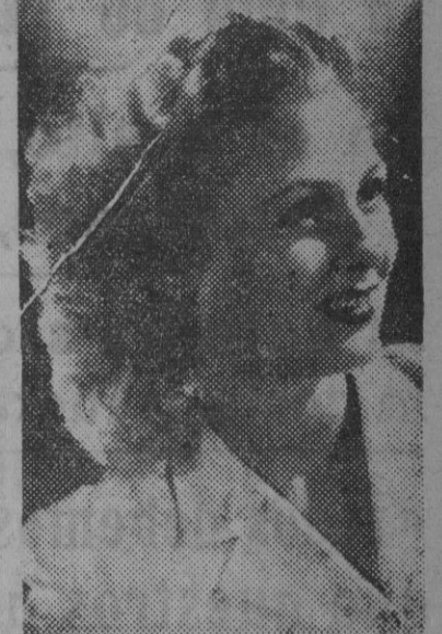
La bellísima y exquisita actriz cinematográfica Charlot Montemayor, que desempeña el segundo papel femenino en la nueva película "Leyenda de Navidad"...