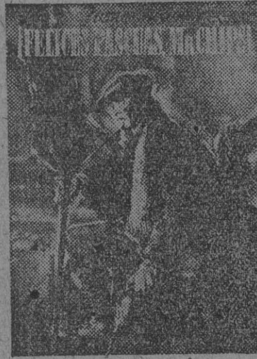
cuenda como una de las pocas cosas que merecen recordarse con verdadero amor.

en bicicleta por cualquier camino del lugar donde veraneas o vives. Pero está, qué duda cabe, estuvo siempre en un rincón cualquiera de tu vida, y el día meros pensado lo recordarás, te encontrarás con él en cualquier rincón de tu imaginación o de tu vida de muchacho, esa que, desgraciadamente, no volverá nunca y que, por lo tanto, se re-