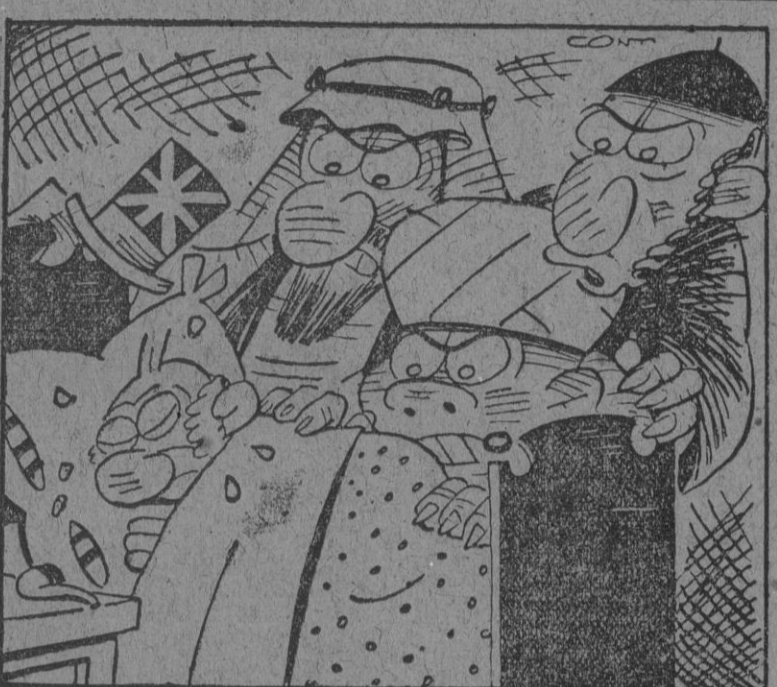
O el sueño de una noche de verano