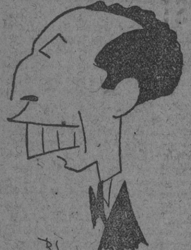
FIGURA DE LA ESCENA ANECDOTAS TEATRALES

El eminente pianista Semprini, que triunfa diariamente en el espectáculo "Entre dos luces", del Tivoli, y a quien mañana, noche, se dedicará una extraordinaria función homenaje.