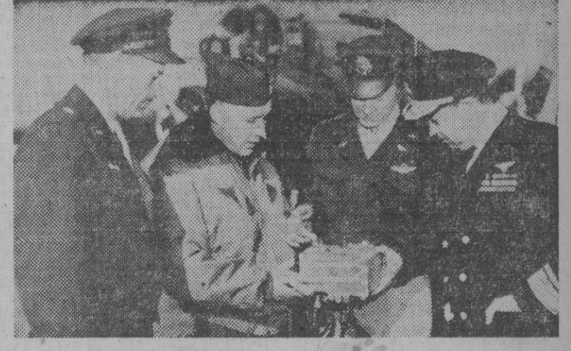
Varios técnicos de las fuerzas armadas norteamericanas examinan el botón que al ser accionado provocó la explosión de la última bomba atómica ensayada en aguas de Bikini.