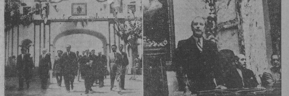
I. El señor Fernández Cuesta, acompañado de las autoridades locales y del presidente del Tribunal Supremo, durante la inauguración del Preventorio infantil «San Francisco Javier». — II. El ministro de Justicia en el momento de pronunciar su discurso de clausura del I Congreso Regional de Trabajadores de Valencia. — (Fotos Cifra)