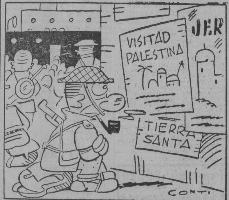
—¿Dónde habrán puesto la propaganda de los hoteles confortables?