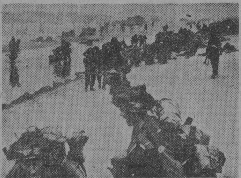
Gracias al acuerdo absoluto entre los jefes del Estado Mayor combinado fué posible la victoria aliada. En la foto, uno de los desembarcos efectuados en Normandía.