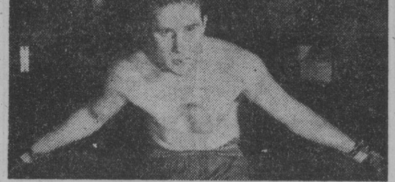
Billy Conn, que el próximo día 19 disputará a Joe Louis el campeonato mundial de los pesados.