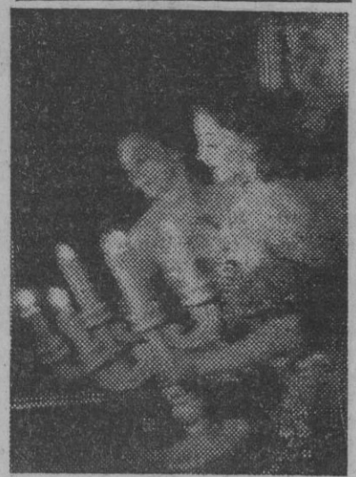
FIGURA DEL TEATRO