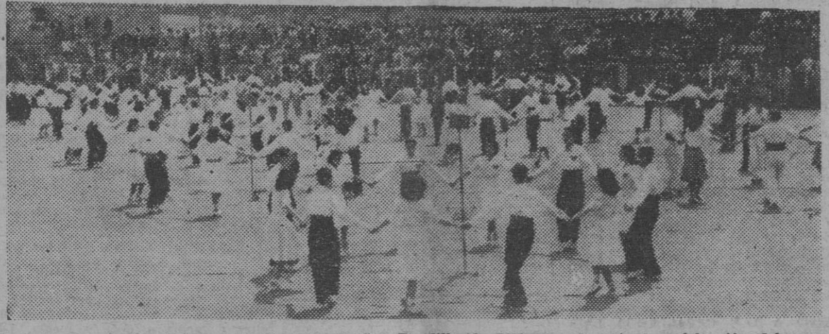
Aspecto que ofrecía el Campo de Deportes de San Baudilio de Llobregat durante la celebración del concurso de sardanas...