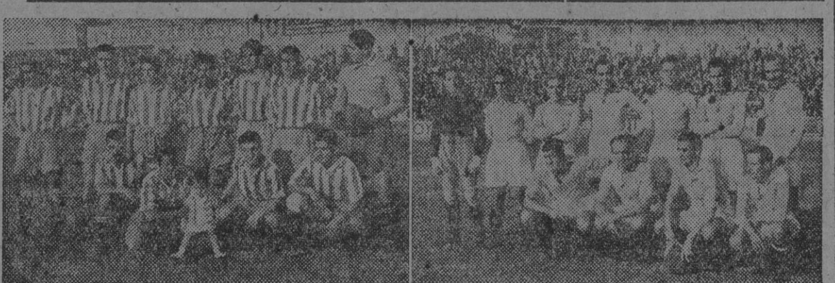
Los equipos del R. C. D. Español y Celta de Vigo, que jugaron ayer en Sarriá.

El Español obtuvo una brillante victoria que le hace revivir su forma de últimos de temporada. Ya parece que ha acertado con el sistema de Casa Rabia, es decir, que se han cambiado jugadores y con el que menos se podían confiar, les dió la victoria más completa de las hasta ahora registradas. Blay fué el autor material del triunfo, y relegado en la caza del balón, ha demostrado en la primera oportunidad que le ha dado, que el triunfo blanquiazul ha tenido más mérito. Perdió el Barcelona su primer partido y con la degradación de una espulsión injusta. Juncosa fué el autor de los dos tantos y no sé si recordará a su antiguo equipo al hacerlos, para brindarles su facilidad de rematador, que tan buena fué en días pasados. El resto de partidos indica que la Liga está entrando en su fase normal. Las victorias de los propietarios, así parece indicarlo, y esta vez hemos descansado de tanto empate y de tantas variaciones en la clasificación.