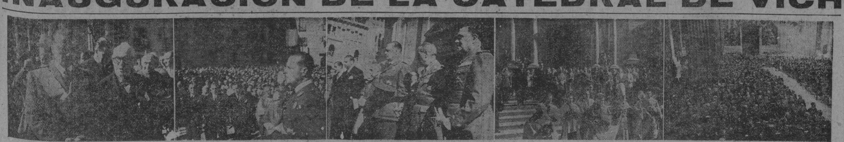
Bajo la presidencia del Excmo. Sr. ministro de la Gobernación, que ostentaba la representación del Caudillo, el ministro de Asuntos Exteriores y autoridades militares, civiles y eclesiásticas, se ha procedido en Vich a la solemne inauguración de su Catedral, completamente restaurada. Nuestra información a gráfica recoge algunos momentos de los actos celebrados en Vich con tan fausto acontecimiento. (VEASE INFORMACION EN LA SEGUNDA PAGINA)