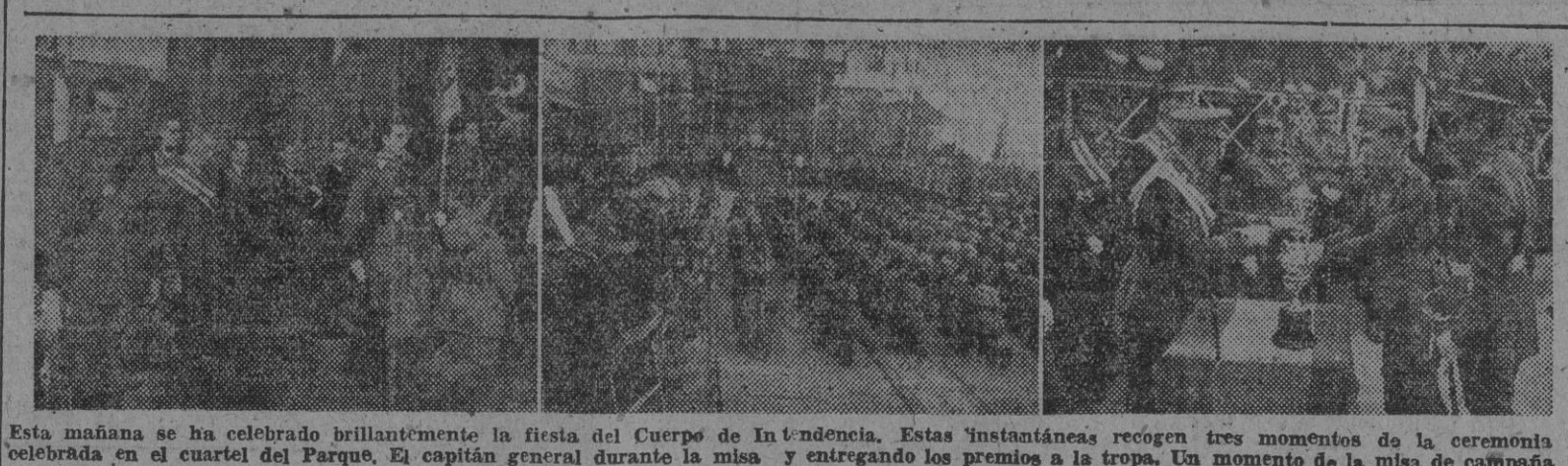
Esta mañana se ha celebrado brillantemente la fiesta del Cuerpo de Intendencia. Estas instantáneas recogen tres momentos de la ceremonia celebrada en el cuartel del Parque. El capitán general durante la misa y entregando los premios a la tropa. Un momento de la misa de campaña