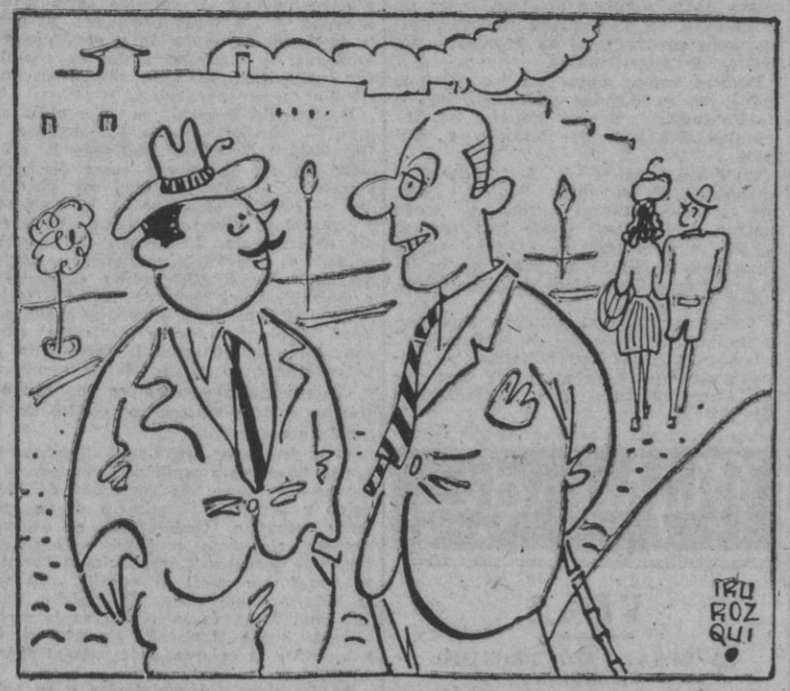
— Prieto ha sugerido una propuesta de cuatro puntos. — Querrá usted decir de cinco. Porque él es otro "punto".