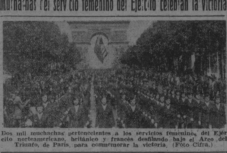
Dos mil muchachas pertenecientes a los servicios femeninos del Ejército norteamericano, británico y francés desfilando bajo el Arco del Triunfo, de París, para conmemorar la victoria.