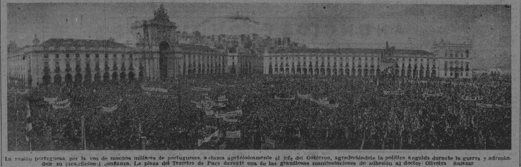
La nación portuguesa, por la voz de muchos millares de portugueses, aclama apotóticamente al jefe del Gobierno, agradeciéndole la política seguida durante la guerra y afirmando su incondicional confianza. La plaza del Terreiro do Paço durante una de las grandiosas manifestaciones de adhesión al doctor Oliveira Salazar.