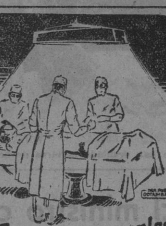
El cirujano emplea en sus operaciones el bisturí...