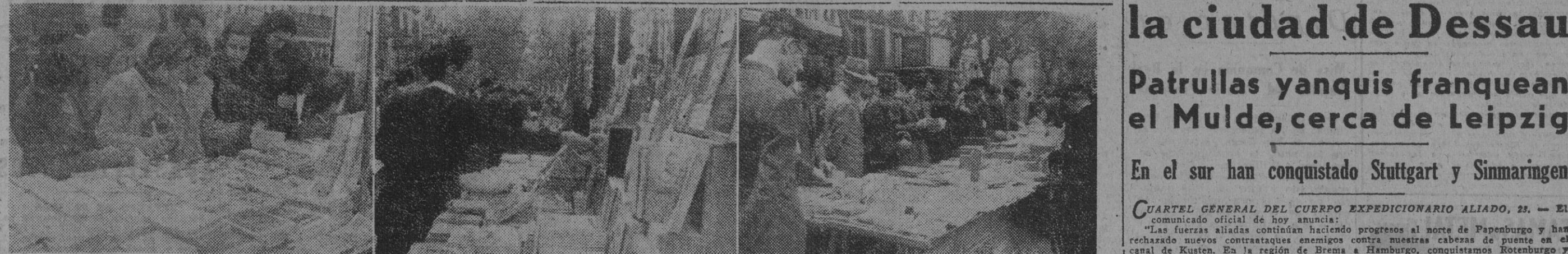
Puestos de libros, instalados en diversos lugares de la ciudad, ante los que han desfilado millares de barceloneses, en esta jornada a ellos dedicada.