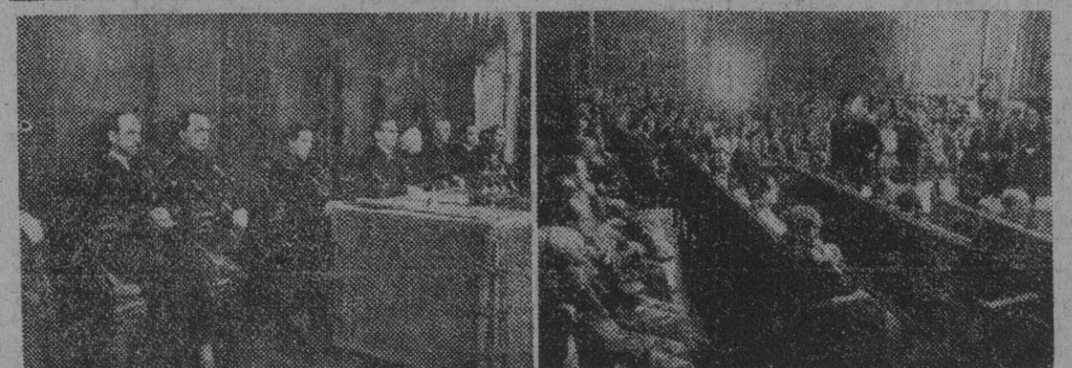
La presidencia del acto y una vista del Salón de Ciento durante la ceremonia de clausura de la VIII Semana de Orientación Pedagógica.