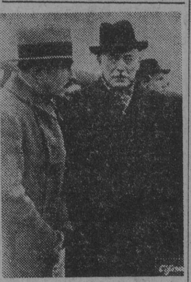
El general alemán Graf von der Schulemburg, que ha sido hecho prisionero por los aliados. La fotografía está obtenida en un aeródromo de Moscú, donde el general era embajador alemán en Rusia cuando se firmó el pacto germano-soviético.

El general alemán Schulemburg, prisionero de los aliados