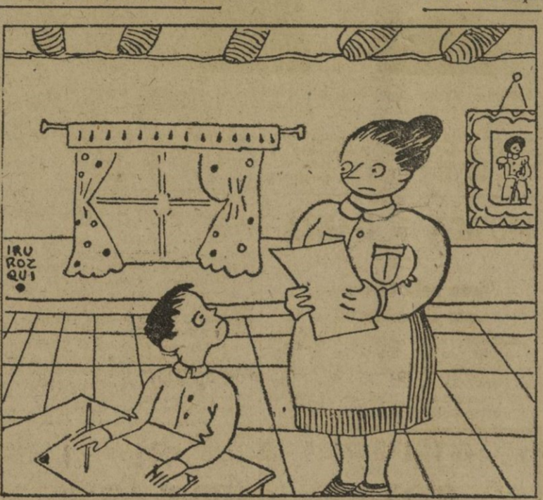
— Pepito, ayir se escribe con y griega y limón con i latina... Pero, ¿por qué me pones jamón con g? — ¡Como tú siempre lo pones con g-latina...!