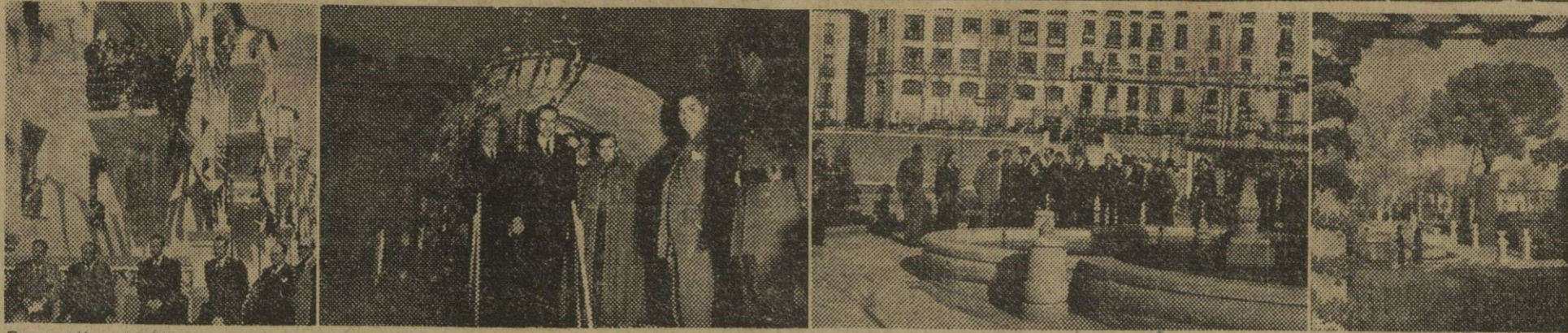
Con motivo del VI aniversario de la liberación de Madrid, el ministro de la Gobernación inauguró diversas obras realizadas en la capital. Las fotografías muestran el nuevo grupo de casas baratas de Cerro Berméjico; las galerías de servicio recientemente construidas y los nuevos jardines de Las Vistillas y del Retiro.