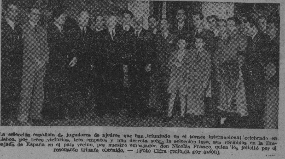
La selección española de jugadores de ajedrez que han triunfado en el torneo internacional celebrado en Lisboa, por trece victorias, tres empates y una derrota contra la selección lusa, son recibidos en la Embajada de España en el país vecino, por nuestro embajador, don Nicolás Franco, quien los felicitó por el resonante triunfo obtenido.