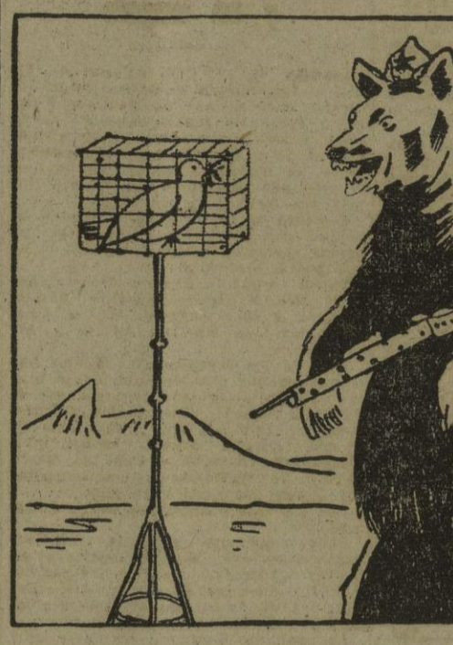
El oso ruso — ¿Cómo me voy a divertir cuando te abran la jaula! ¿Con lo que me gusta a mí el tiro de pichón!