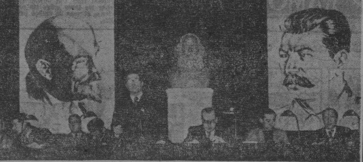
El «Partit Socialista de Catalunya», celebrando un mitin en Barcelona. Las téticas figuras de Stalin, Lenin y Marx, presidían invariablemente todas las reuniones organizadas por dicha dependencia moscovita