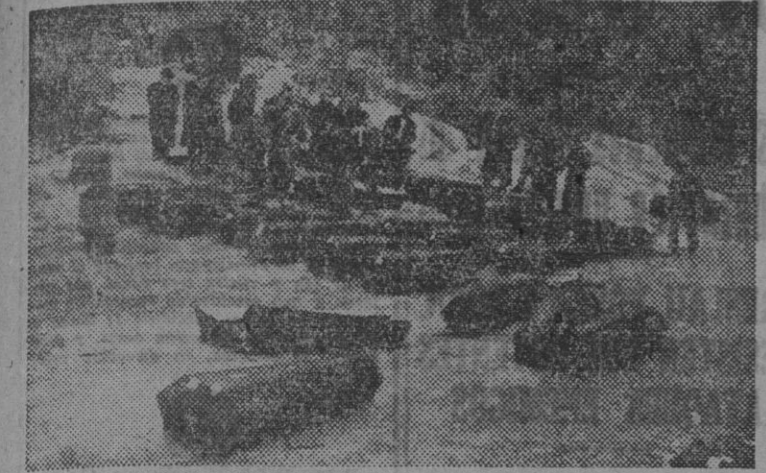
Un pequeño Katyn en la montaña catalana. Matanza de patriotas efectuada por la herda en su huida a Francia. He aquí el claro del bosque del Collet, al ser recogidos los cadáveres de los rehenes asesinados por los rojos al fin de la guerra