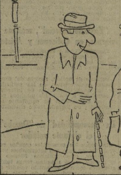
¿Y por qué dice usted que van a galope tendido? ¿Hombré! ¡Están luchando en Bagnacavallo!