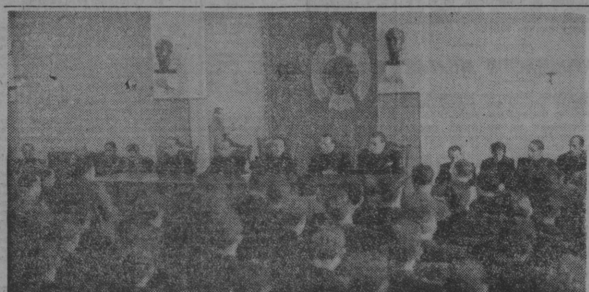
Bajo la presidencia del Excmo. Sr. ministro secretario general del Movimiento, camarada Arrese, se ve la clausura del III curso de oficiales instructores del Frente de Juventudes, que se ha seguido en la Academia de Mandos "José Antonio".