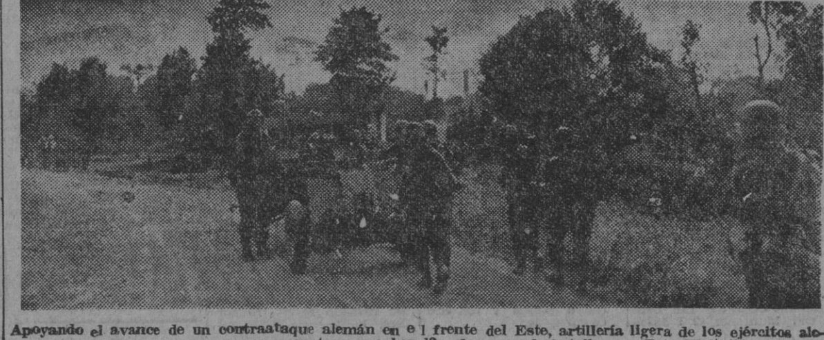
Apoyando el avance de un contraataque alemán en el frente del Este, artillería ligera de los ejércitos alemanes avanza por una carretera que bordea el campo de batalla.