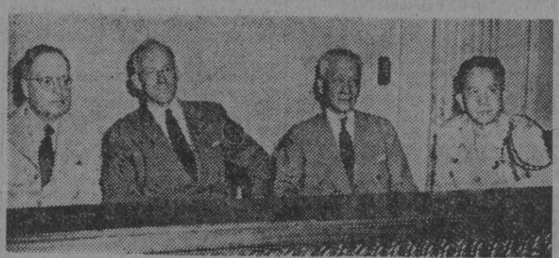
Los miembros de la Comisión de Rehabilitación de Filipinas, en la reunión que tuvieron meses antes de que se produjeran los desembarcos norteamericanos en las islas del archipiélago y en la que trataron de asuntos relacionados con las proyectadas operaciones

Antes de los desembarcos norteamericanos en Filipinas