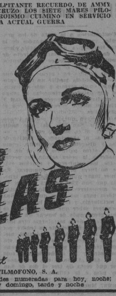
ANA NEAGLE, PROTAGONISTA DEL FILM «LA MUJER Y LAS ALAS», QUE HOY SE ESTRENA EN EL CINE ALCAZAR