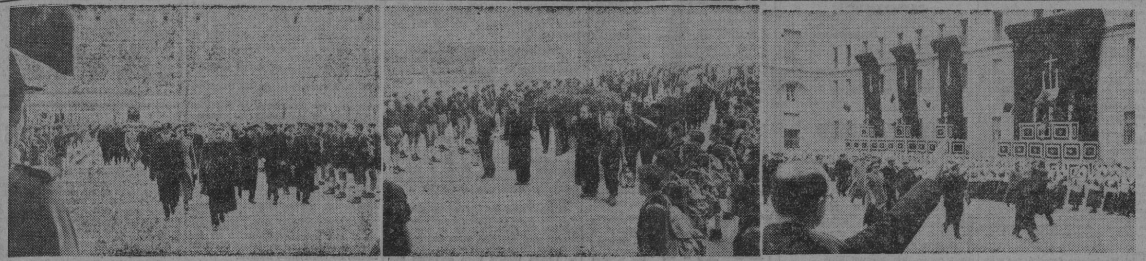
En el Monasterio de El Escorial, y bajo la presidencia de S. E. el Jefe del Estado, se celebraron ayer solemnes honras fúnebres en memoria del Fundador de la Falange, José Antonio Primo de Rivera. Nuestra información gráfica recoge: I. S. E. el Generalísimo, a su llegada al Monasterio. — II. Una monumental corona, llevada a hombros desde Madrid por la Falange madrileña, en el momento de llegar a El Escorial. — III. S. E. el Jefe del Estado, alravesando el Pabellón de los Reyes, durante la ceremonia habida en el histórico Monasterio.

Han sido conquistadas Dieuze, Lellingen, Altkirch y muchas otras localidades