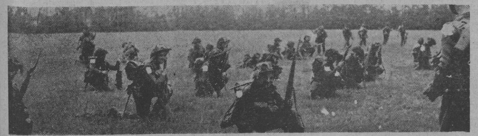
Tropas británicas desplegadas en el frente de Normandía esperando la orden de ataque.