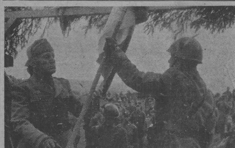
Mussolini en el acto solemne de la entrega de su nueva bandera a la división italiana "Monte Rosa", que lucha al lado de las fuerzas alemanas.