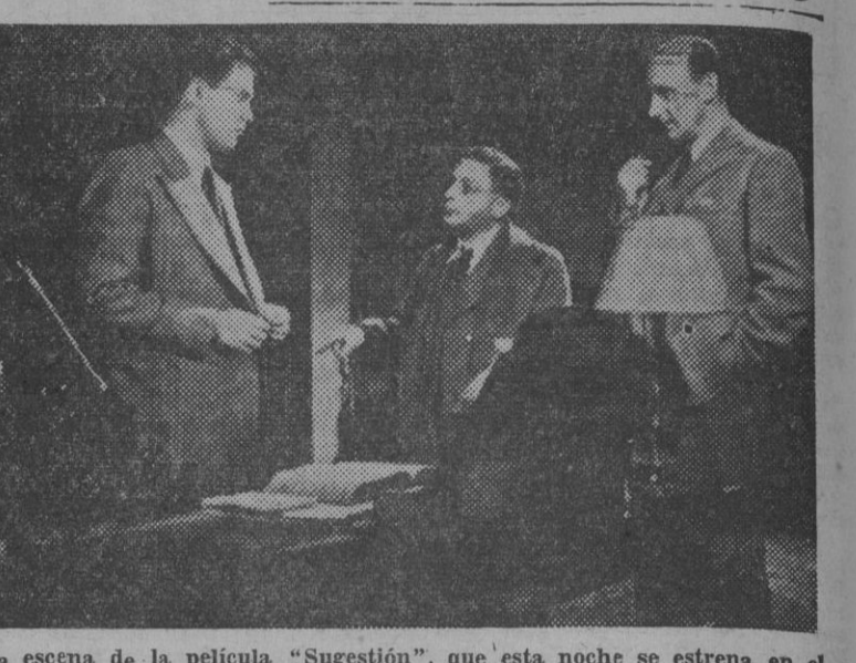
Una escena de la película «Suegión», que esta noche se estrena en el Astoria

«Arizona», por Marlene Dietrich; «Crimen y castigo» por Peter Lorre y «Noticiero «NO. DO»».