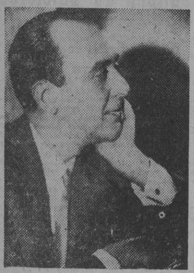
FIGURA DE LA ESCENA