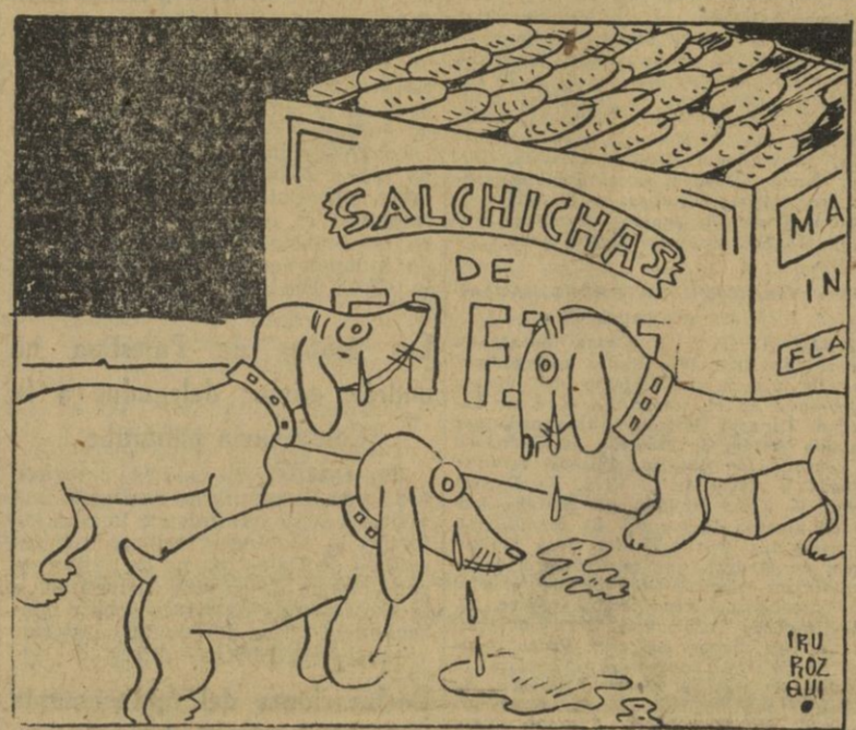
La perra: — ¡Llorad, hijos míos! ¡Estáis ante la tumba de vuestro padre!