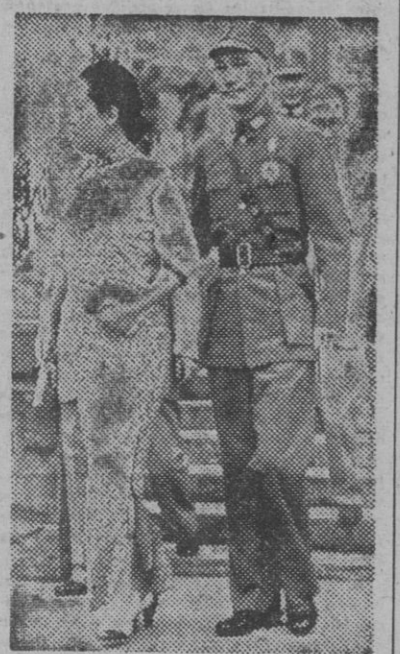
El general Chiang Kai Shek, que ha sido nombrado presidente de la república china, paseando del brazo de su cuñado, Masung Kung, esposa del ministro de Hacienda de Chung King.