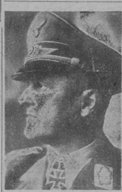
Como sucesor del general Jeschonek, recientemente fallecido, ha sido designado jefe del E. M. de la Luftwaffe, el general de aviación Günther Korten.