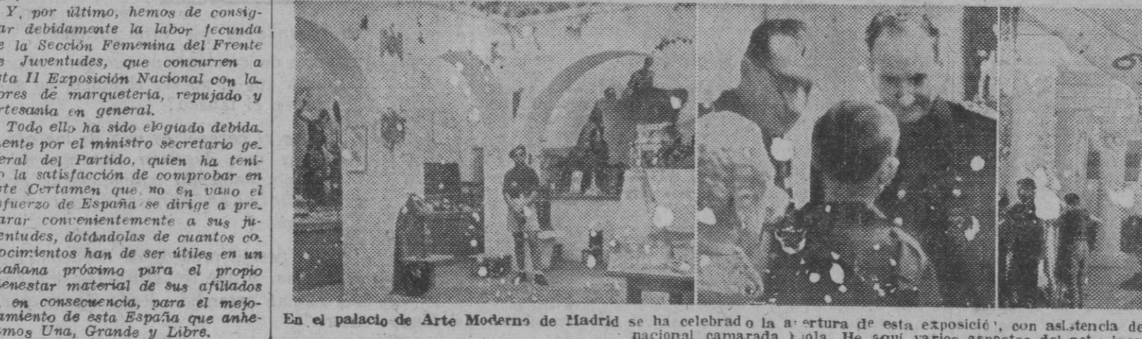
En el palacio de Arte Moderno de Madrid se ha celebrado la apertura de esta exposición, con asistencia del ministro secretario del Partido, camarada Arrese, y del delegado nacional, camarada Lolo. He aquí varios aspectos del acto inaugural.