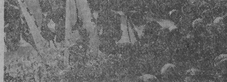
Misa de campaña, en la Rambla, el 27 de enero de 1941

Entre dolor, miseria y sufrimientos pasó la ciudad de Badalona el Calvario de la dominación roja que si hirió sus carnes no llegó a mixtificar el corazón de los badaloneses que esperaban la ansiada liberación. Por fin llegó tan fausto día y el pueblo, el verdadero pueblo badalonés, lanzó a la calle a rendir tributo de agrado decimiento a sus liberadores. 26 de enero de 1939. Día de nevísimo. Los badaloneses, a las salidas de que era inmediata su liberación, vivían minutos que parecían años y horas que eran días, mientras durante toda la jornada desfilaban incesantemente por la carretera de Francia los últimos residuos del Ejército rojo y caravanas de forajidos, que extenuados y famélicos no querían,