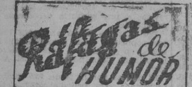
GUERRA DE LOS CIEN AÑOS

Comunicado italiano ROMA, 27. — Comunicado de guerra italiano: "En Tripolitania Occidental se señalan pequeños encuentros entre los elementos motorizados..."