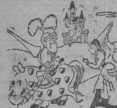
EL GUERRERO. — Amada mía. Me han dado un permiso cortísimo de cinco años, y después dos...

LONDRES, 27. — Comunicado del Ministerio del Aire: "La base enemiga de submarinos de Lorient ha sido bombardeada..."