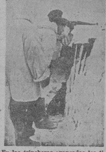
En las trincheras avanzadas los tiradores se preparan porque han apercibido algún movimiento en el campo enemigo.