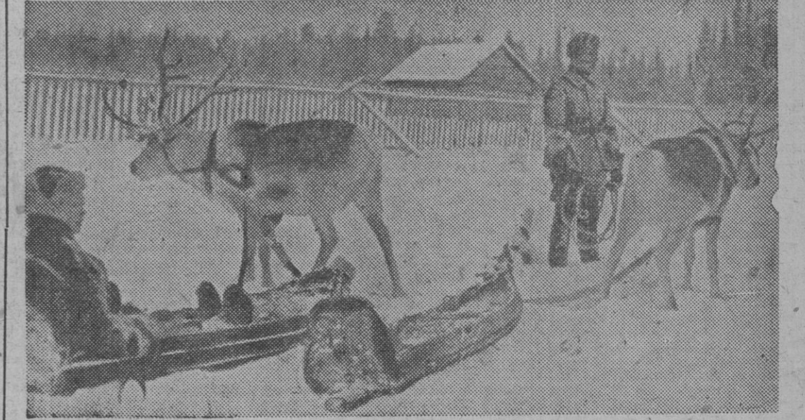
En el remoto norte de Europa, un soldado alemán y otro finlandés se encuentran al final de su patrulla de vigilancia facilitada por los trineos lapones, conducidos por renos.