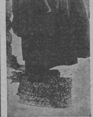
Además de las botas de fieltro, y sobre ellas, los soldados del frente del Este protegen sus pies del frío con zapatos especiales contruados de paja trenzada.