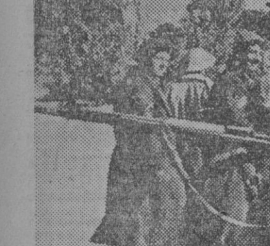
Custodiados por soldados del Eje, un grupo de ingleses, capturados en los encuentros del frente tunecino, son conducidos a la retaguardia.