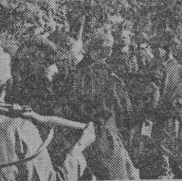
Custodiados por soldados del Eje, un grupo de ingleses, capturados en los encuentros del frente tunecino, son conducidos a la retaguardia.