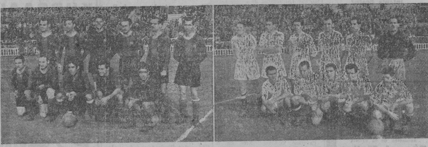
Los equipos del Barcelona y Madrid que ayer empataron en Las Cortes.