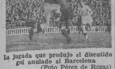
La jugada que produjo el discutido gol anulado al Barcelona.