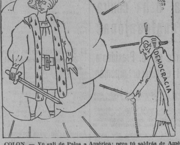
COLON. — Yo salí de Palos a América; pero tú saldrás de América a palos.