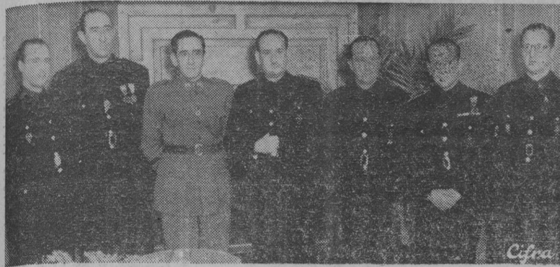
El Ministro Secretario General del Partido, camarada Arrese, se reúne con los ex Secretarios Generales del Partido, camarada Raimundo Fernández Cuesta, embajador de España en el Quirinal, y teniente general Muñoz Grandes.

El camarada Arrese se reúne con los ex Secretarios Generales del Partido