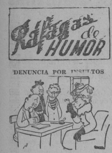
La denunciante: En razón de las circunstancias debo aclarar que no fué exactamente la expresión de "vieja vaca" lo que me ofendió, sino el tono con que fué pronunciada.