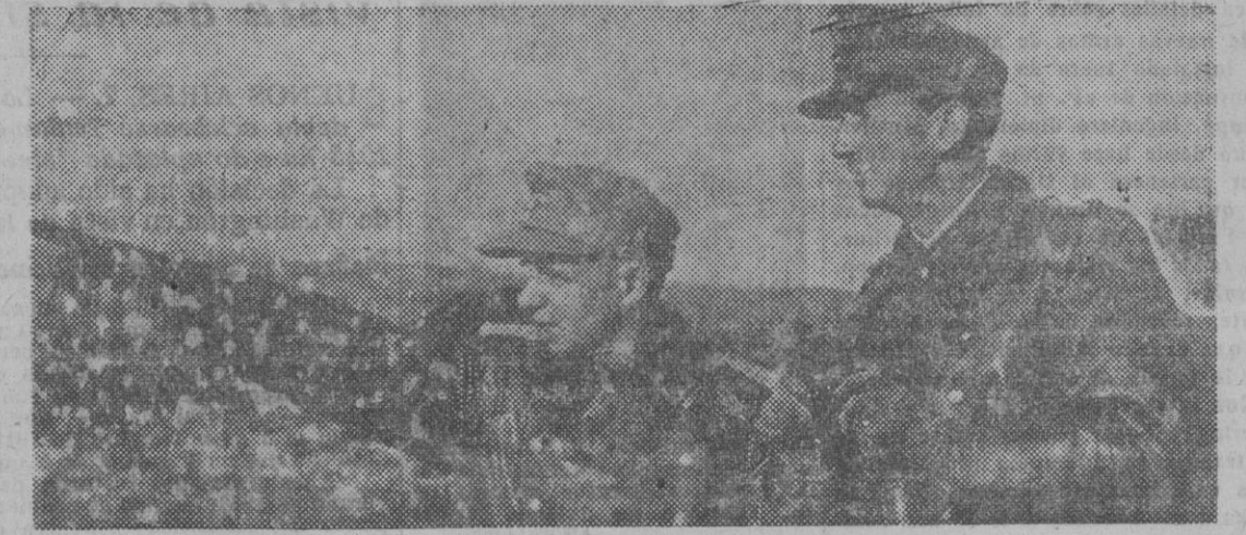
El general Dietl, jefe del Ejército alemán del Norte, oyendo los informes que le da el comandante de un batallón, durante una de sus visitas a las líneas avanzadas del frente ruso.

Visita de inspección a las líneas avanzadas