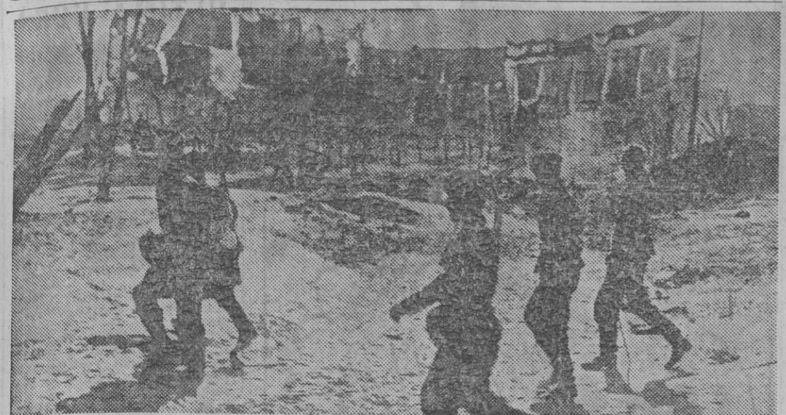
Una constante vigilancia se efectúa en los terrenos recién conquistados, a fin de limpiarlos de enemigos resacados y de recoger los explosivos abandonados en las zonas que fueron de combate. La fotografía nos muestra una patrulla del Ejército alemán, en el cumplimiento de su delicada misión.