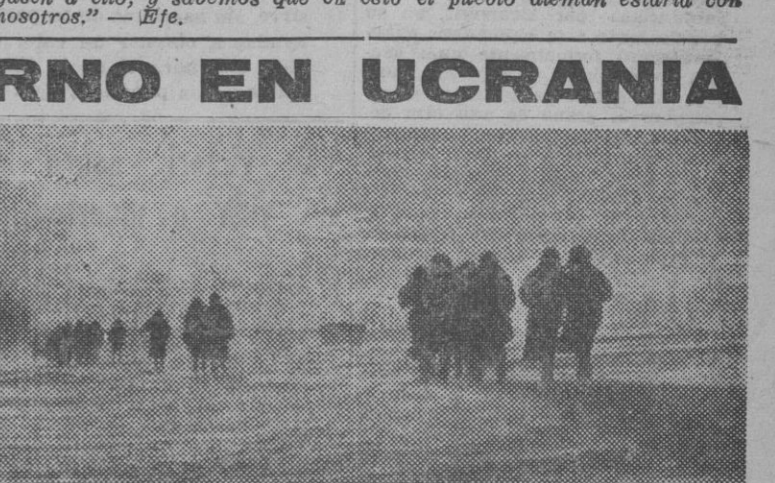
Curiosa fotografía de las llanuras ucranianas, donde se refleja la melancólica impresión de estas tierras en la estación invernal.