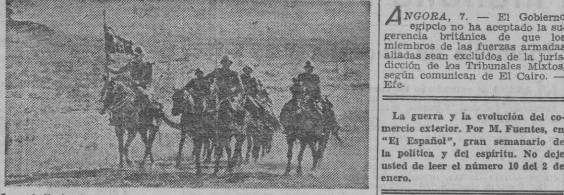
La caballería italiana ha tenido una eficaz participación en las operaciones libradas en el frente ruso. La fotografía presenta un grupo de jinetes patrullando por la estepa.