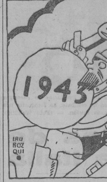
MARTE: — ¡Ya nadie me quita otro año de faena...