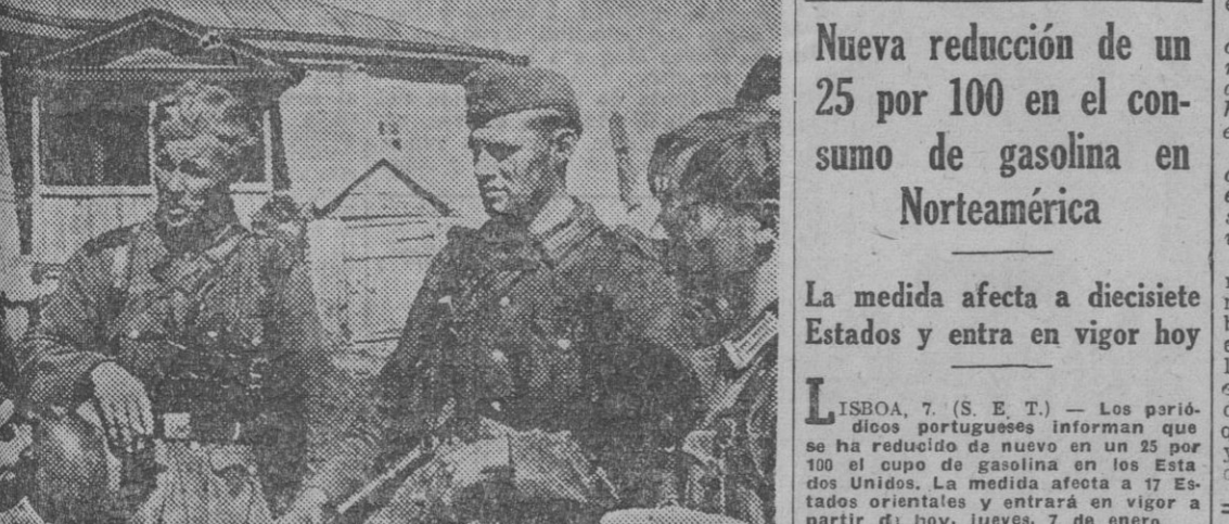
En un breve descanso, después de una batalla ante Voronej, los soldados del Reich comentan las incidencias de la lucha victoriosa.