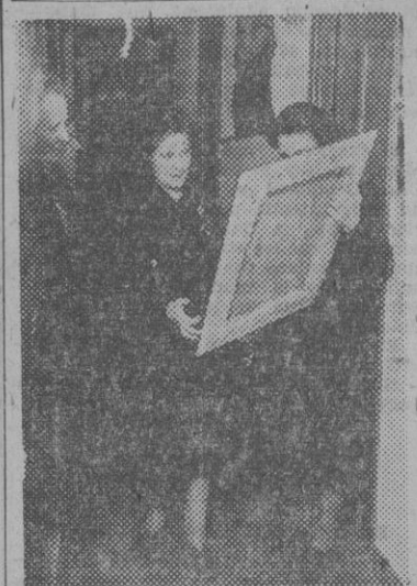
La Delegada Nacional de la Sección Femenina, camarada Pilar Primo de Rivera, examinando una obra durante la inauguración de la Exposición de pinturas celebrada ayer en Madrid, en el Círculo Medina