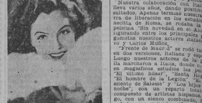
Magda Scheider, una de las más jóvenes "estrellas", cuya actuación ante las cámaras es objeto de grandes elogios, por su naturalidad y acusada sensibilidad artística

Sensible aumento del número de espectadores en los cines alemanes