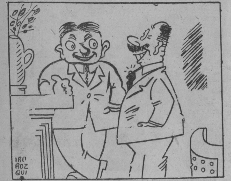
—Creo que era una división. —Sí; por eso los han dividido.