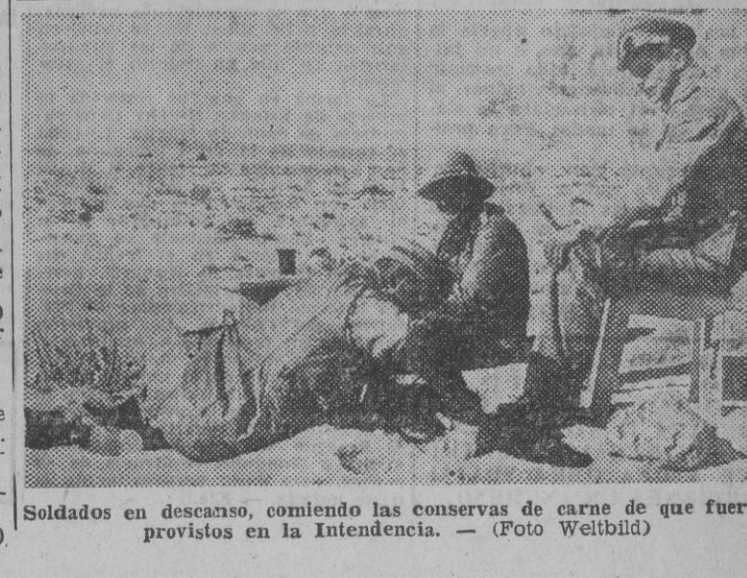
Soldados en descanso, comiendo las conservas de carne de que fueron provistos en la Intendencia.