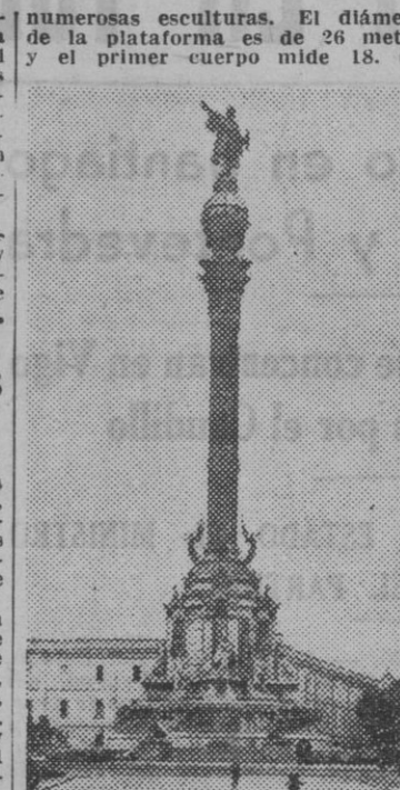
La estatua mide 750 metros; el monumento, 59 metros; la columna triunfal pesa 42,000 kilos, y la obra, en conjunto, 233,000 kilos.

La estatua propiamente dicha es de bronce, obra de Rafael Aché y Farré, que falleció en 1883.