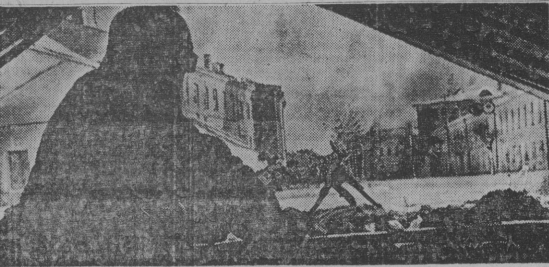
Los últimos bloques de casas de una ciudad rusa resisten en actitud suicida ante el avance de las fuerzas que luchan contra el comunismo. Las tropas alemanas hacen desistir este intento vano y las ametralladoras cantan la sintonía de la muerte y de la victoria en el último reducto del vencido.