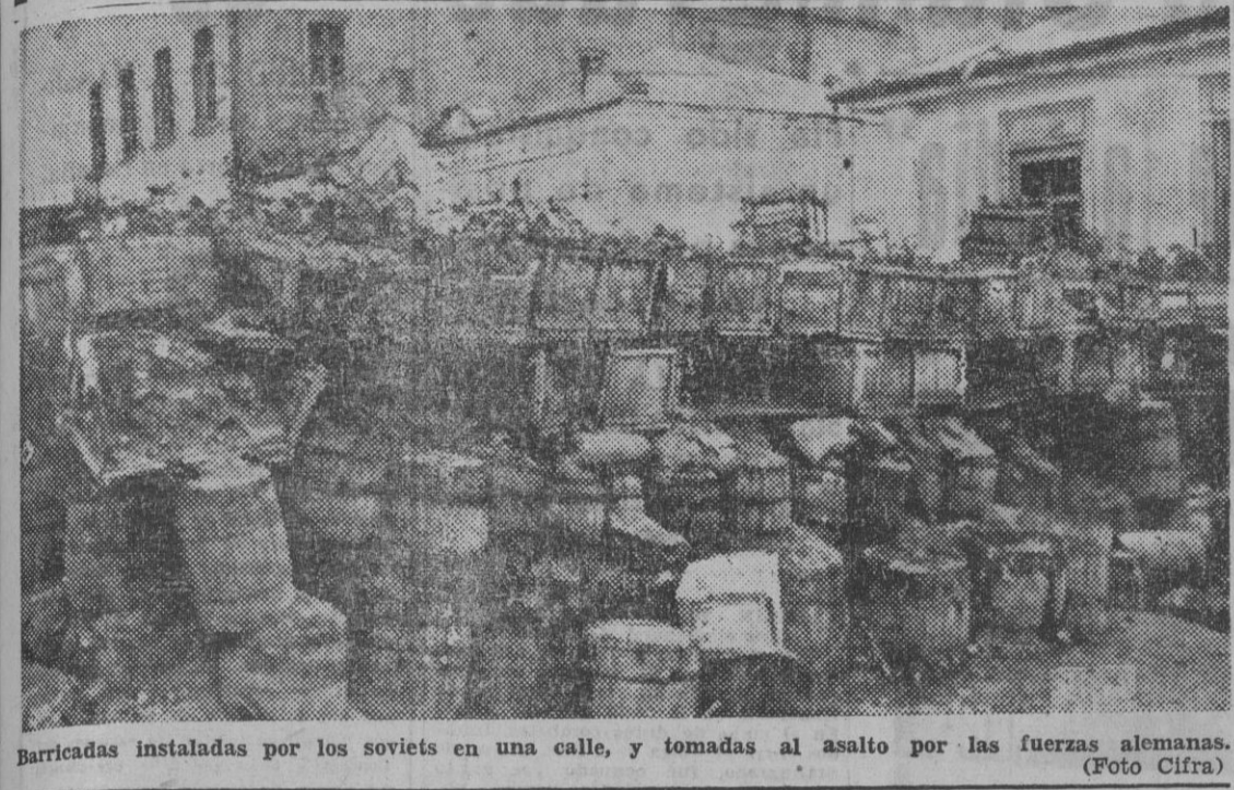
Barricadas instaladas por los soviets en una calle, y tomadas al asalto por las fuerzas alemanas.