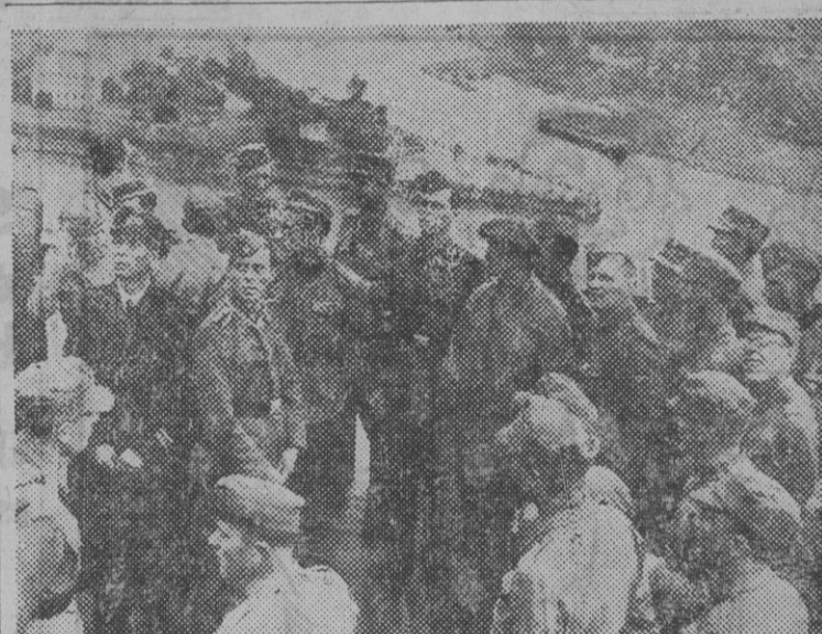
Heridos finlandeses visitando en viaje de permiso la ciudad de Colonia