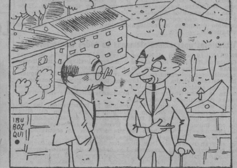
Churchill ofreció a Stalin el segundo frente... Será como repuesto, porque el primero se los acaba.