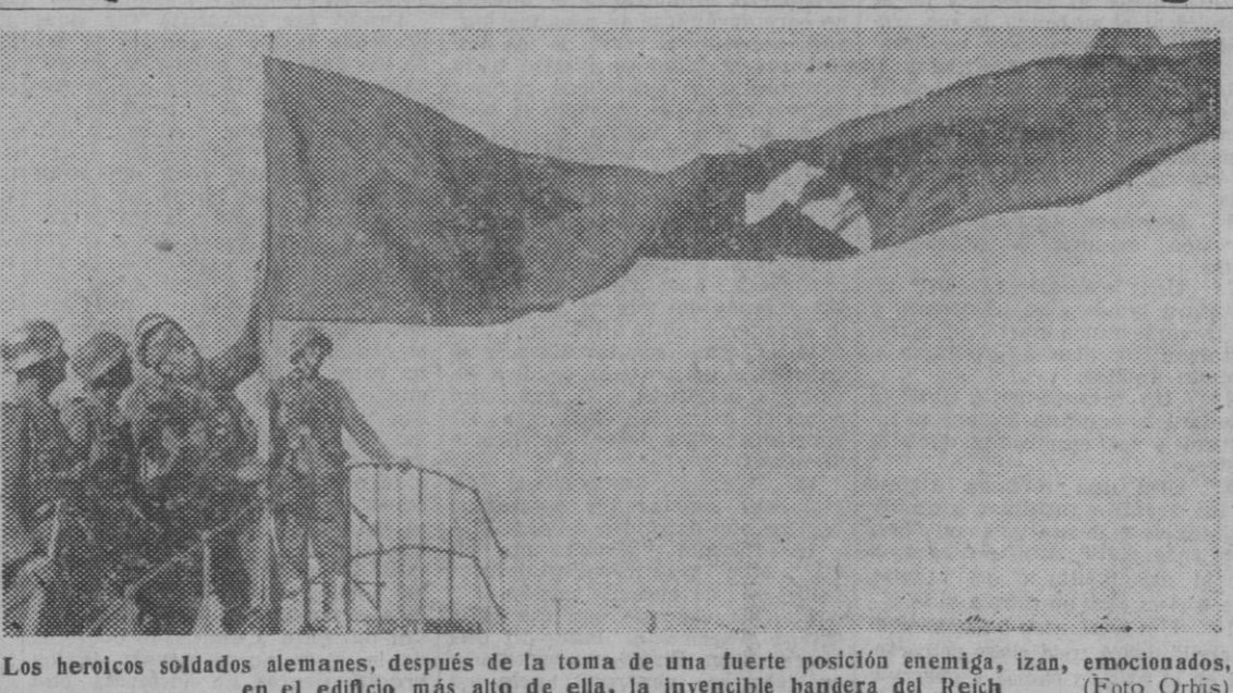
Los heroicos soldados alemanes, después de la toma de una fuerte posición enemiga, izan, emocionados, en el edificio más alto de ella, la invencible bandera del Reich.