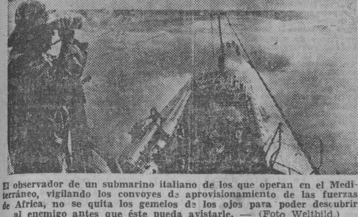
El observador de un submarino italiano de los que operan en el Mediterráneo, vigilando los convoyes de aprovisionamiento de las fuerzas de África, no se quita los gemelos de los ojos para poder descubrir al enemigo antes que éste pueda avistarlo.