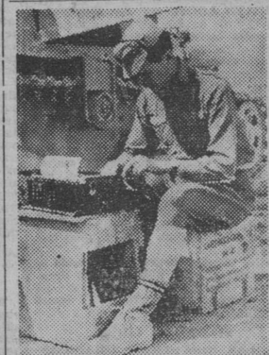
Los correspondientes de guerra, entre batalla y batalla, descansan al lado de su tanque, escribiendo sus emocionantes reportajes

El almirantazgo británico confiesa sus pérdidas en el Mediterráneo