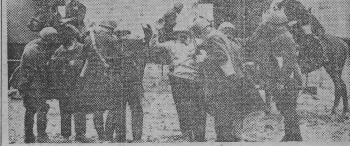
La caballería italiana en el frente oriental, en sus acciones de policía y destrucción de bandas de franco-tiradores, cacha a varios prisioneros cogidos en una casa donde se habían hecho fuertes.