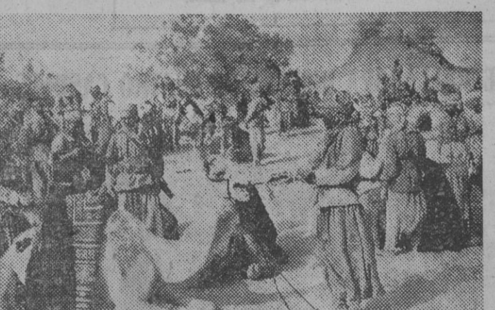
El camello es uno de los elementos que, en contraste con los vehículos motorizados, actúan en el frente libico, por su resistencia, docilidad y por encontrarse en su propio ambiente