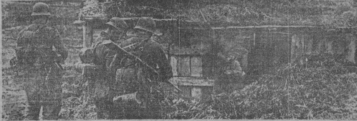
La infantería alemana efectuando una operación de limpieza en los poblados y cabanás del territorio ruso recientemente ocupado