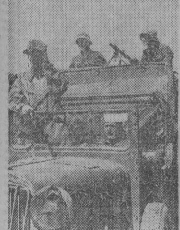
El comandante de un regimiento de tanques observa, desde su coche, el curso de las operaciones de las fuerzas de su mando.