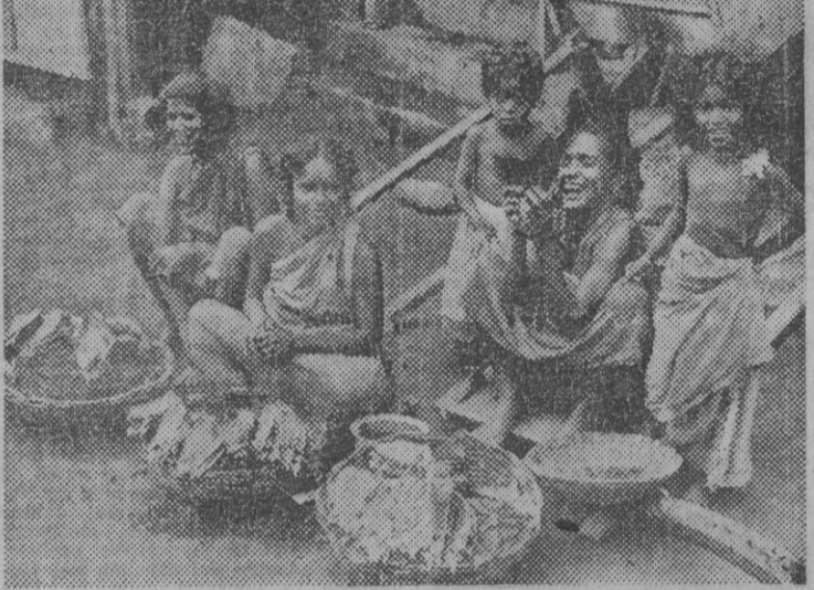
Grupo de hindúes en las calles de Calcuta.

LONDRES, 13. — La actual situación en diversas ciudades de la India puede resumirse de la siguiente manera, de acuerdo con las informaciones transmitidas por los corresponsales de la Agencia Reuters.