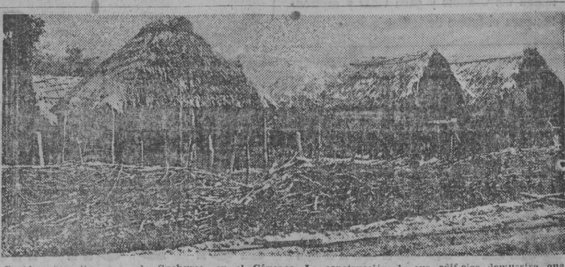
Pueblo mingirli, cerca de Suchuma, en el Cáucaso. La construcción de sus edificios demuestra que no ha pasado de la época primitiva de la actual civilización.