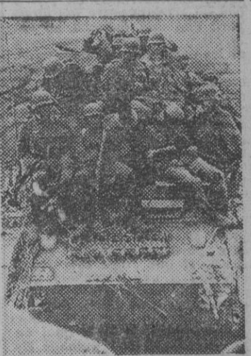
Mientras unos soldados vigilan, otros descansan durante el avance para tomar la última posición enemiga del sector del Don, en el frente del Este.