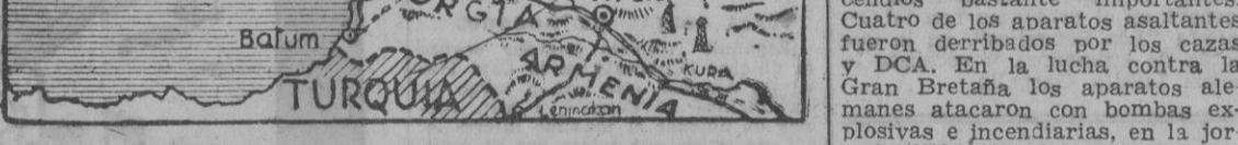
final de la U. R. S. S., para un breve plazo, que va desde el mes y medio a los tres meses. La conferencia soviético-anglo-americana celebrada en Moscú, ha terminado sin poder resolver los problemas que hubo de afrontar. Los soviets dan por perdido el Cáucaso; una orden tajante ha sido circulada a las organizaciones campesinas imponiéndoles la obligación de efectuar a mano la recolección de la cosecha, a fin de economizar combustible líquido, y recomendando la tracción animal en el transporte, con el mismo objeto.

La lucha en el frente ruso continúa desarrollándose con el signo favorable a los alemanes que caracteriza a la campaña iniciada el primero de julio último. Distintos hechos inclinan a los comentaristas extranjeros a hablar de un posible "erotic" definitivo del bolchevismo, siendo los escritores anglo-sajones los que fijan la derrota