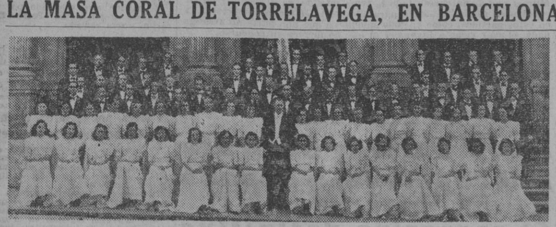
He aquí a los componentes de la Masa Coral de Torrelavega, que esta mañana han llegado a nuestra ciudad y que darán esta noche un concierto en el Palacio de la Música.

Apertura de la Semana de Administración Local... La sesión inaugural se celebra esta tarde en el Salón de Ciento del Ayuntamiento... PRESIDE EL GOBERNADOR CIVIL Y JEFE PROVINCIAL DEL MOVIMIENTO