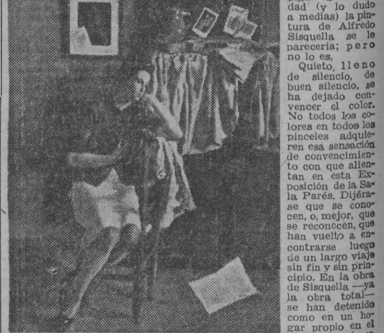
INTERIOR, por A. Sisquella