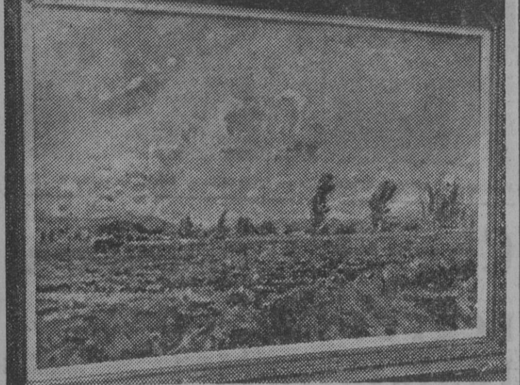
PAISAJE, por Amat