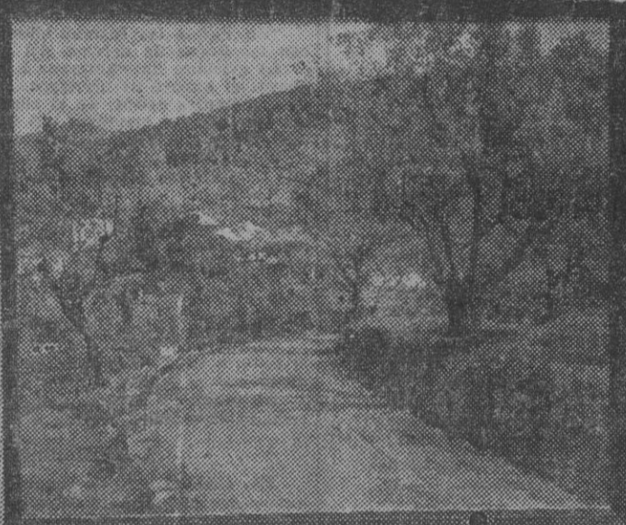
OLIVOS, por Vilá Cañellas