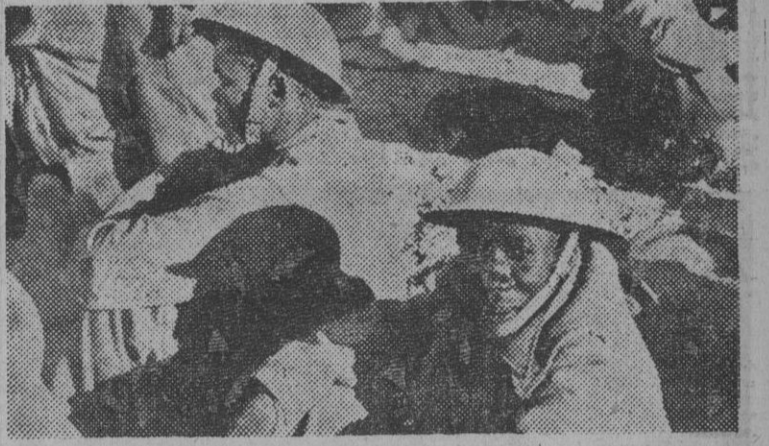
Prisioneros ingleses capturados en la batalla de Libia.