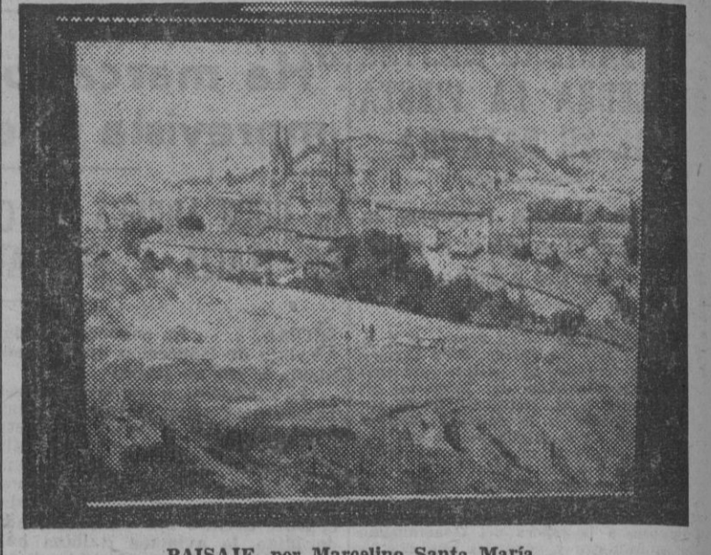
PAISAJE, por Marcelino Santa María