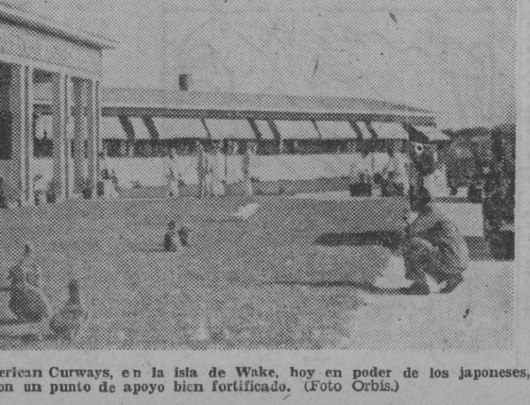
Vista del hotel de la Pau-American Curways, en la isla de Wake, hoy en poder de los japoneses, que cuentan con un punto de apoyo bien fortificado.