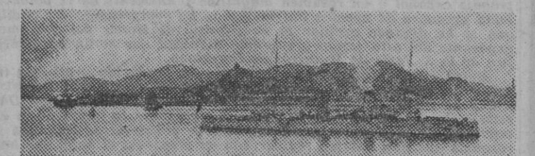
Barco de guerra inglés en el puerto de Hong-Kong