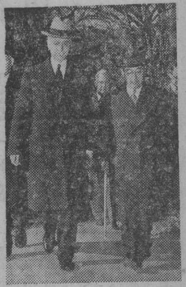
El enviado extraordinario japonés en Washington, Kurusu, paseando con Cordell Hull durante sus frías negociaciones en la capital de los Estados Unidos