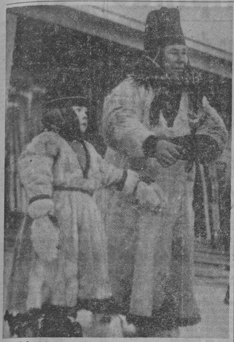
He aquí dos interesantes figuras, madre e hija, de una familia lapona del pueblo de Jokkmokk, situado al norte de Finlandia, el cual se encuentra aislado del mundo por un bosque inmenso, y en donde no se oye ni se sabe de la guerra en Europa ni en el Pacífico.