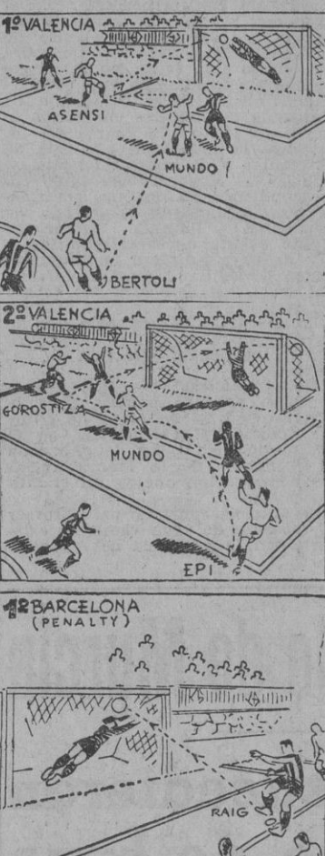
Gráfico de los tres primeros goles de la tarde

Si el Celta no hubiera conseguido un empate en Nervión, ante el Sevilla, podríamos decir que la jornada de Liga terminó ayer con normalidad. Los resultados fueron los que debían producirse, si bien el tanteo del Castellón sobre el Alicante fue, con el empate en Sevilla, lo único sorprendente.