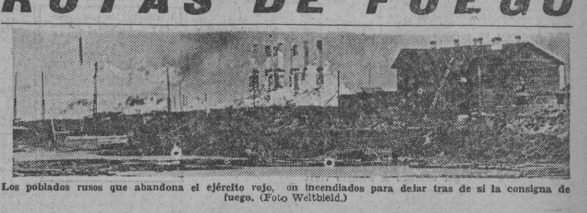
Los poblados rusos que abandona el ejército rojo, son incendiados para dejar tras de sí la consigna de fuego.