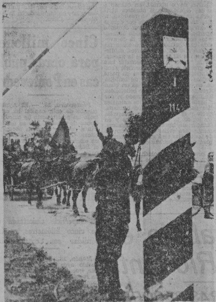
La División Azul se incorpora al frente de combate para tomar parte en la lucha contra el comunismo.

Madrid, 18: 4 tarde. (Por teléfono). — A falta de un tema que encierre vibrante actualidad y al socaire del cálido sosiego de este mediodía septembrino, hemos de buscar el motivo de nuestra crónica en las páginas tersas y geométricas de los periódicos. A este respecto, el diario "Ariba", pródigo siempre en valiosa colaboración, inserta en su número de hoy un artículo que bien vale la pena de ser señalado y reproducido, aún parcialmente.