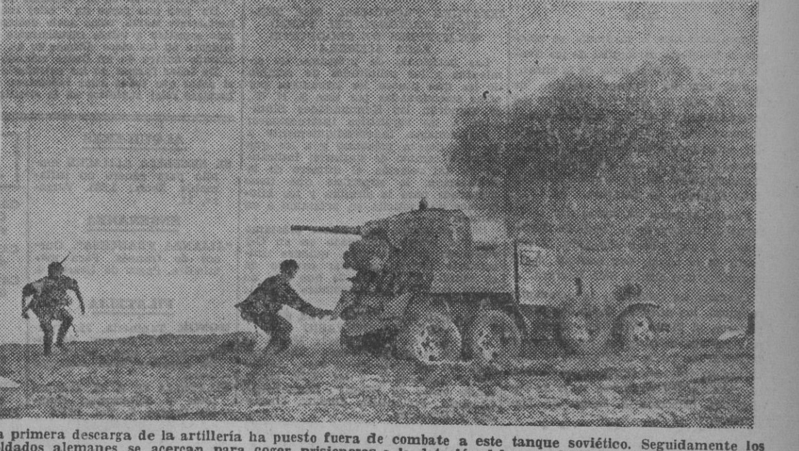
La primera descarga de la artillería ha puesto fuera de combate a este tanque soviético. Seguidamente los soldados alemanes se acercan para coger prisioneros a la dotación del carro de hierro.