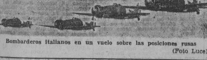
Bombarderos italianos en un vuelo sobre las posiciones rusas