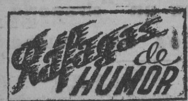
Yo me hago tatar un chaleco. (De "Candide")