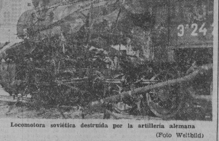
Locomotora soviética destruida por la artillería alemana

UN BLANCO MAGNIFICO Los soviets pagarán con minería es