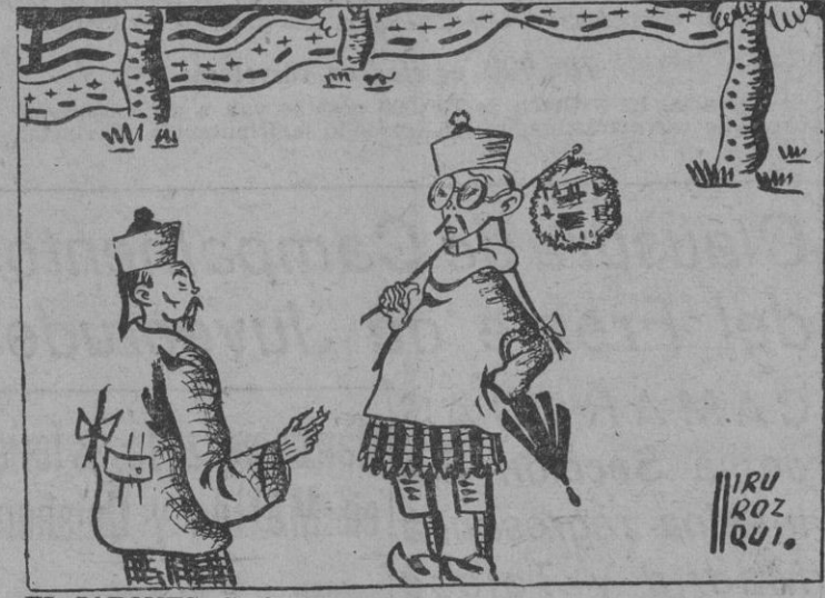
EL JAPONÉS: Si América quiere venir a buscar nuestra seda, les vamos a dar "hule".