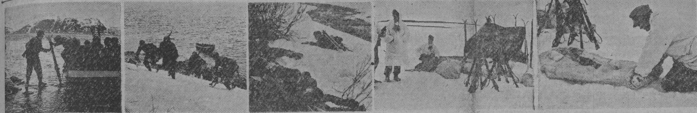
Los finlandeses han dado cima a su heroica empresa: todo el territorio ocupado por los bolcheviques mediante la vergonzosa "paz de Moscú" de 1940, ha sido liberado por las armas germano-finesas. Ha aquí una película explicativa de la titánica lucha desarrollada en el frente septentrional finlandés: 1. Una sección de Infantería atraviesa un lago, con objeto de apoderarse de posiciones indispensables para la paz, fueran estériles, el mensaje, y son en el momento presente el más firme puntal del porvenir de la nación turca. — 2. Soldado desfilando el saco especial dentro del cual ha de embutirse para dormir sin correr el peligro de una congelación. Los soldados de este frente van provistos de un equipo especial propio para la lucha entre los hielos.