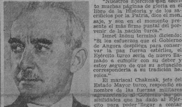
Ismet Inonu, jefe del Estado turco, tropas turcas disponen de la suficiente fuerza como para poder hacer frente con buen éxito a los acontecimientos.

Angora, 1. — El presidente Ismet Inonu ha dirigido un mensaje al Ejército con ocasión del XIX aniversario de la victoria de Turquía en su lucha por la libertad.