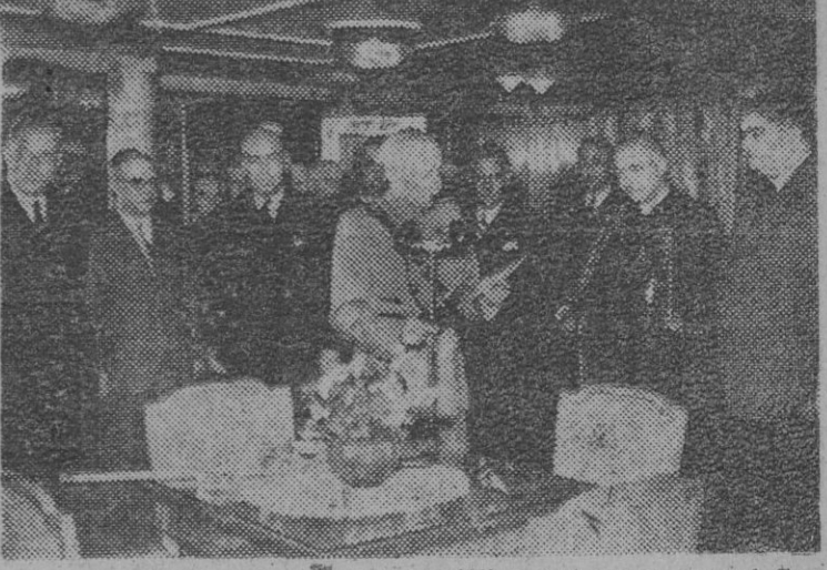
Lisboa. — El Presidente de la República portuguesa, general Carmona, parte para las Azores, en visita oficial. A bordo del "Carvalho Araújo", el general Carmona lee, ante el micrófono, unas palabras de salutación a los portugueses de todo el Mundo.