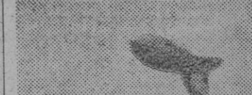
Para observar los tiros de la artillería, un globo de barrera alemán se eleva al espacio en actitud vigilante.