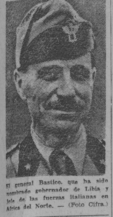
El general Bastico, que ha sido nombrado gobernador de Libia y jefe de las fuerzas italianas en África del Norte.